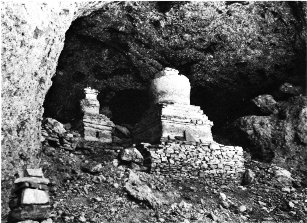
Abb. 3 Die große Höhle 'Od-gsal badzra phug