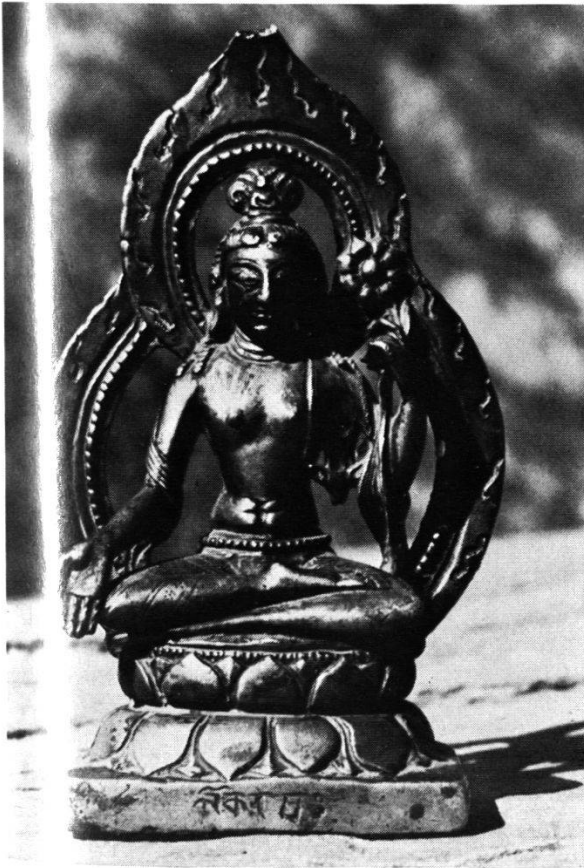
Abb. 2 Bronze des Lokésvara (Padmapâni) aus dem 8. bis 9. Jahrhundert