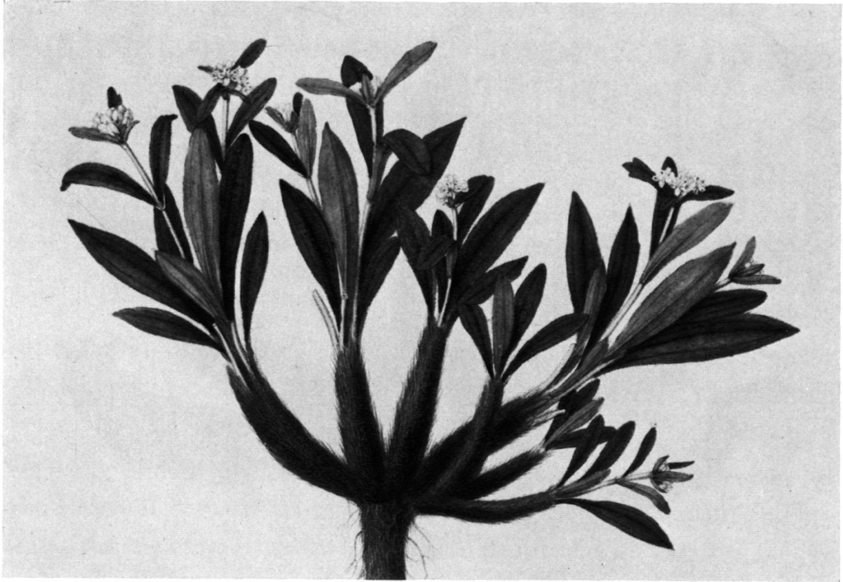
Nardostachys jatamansi DC.

Abb. aus ROYLE, Illustrations of the botany and other branches of natural history of the Himalayan mountains, Bd. II, 1893, Tafel 54.