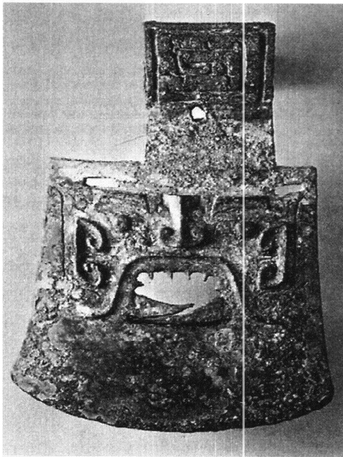
Abb. 1: Axtblatt des Typs Yue , 11.-10. Jh. v.u.Z., Bronze, H. 30.4 cm, B. 35 cm, Gewicht: 4.8 kg, Staatliche Museen Preussischer Kulturbesitz, Museum für Ostasiatische Kunst, Berlin (Inv.Nr. 1962-4). (Nach Jan Fontein, Wu Tung: Unearthing China's Past . Boston 1973, Abb. 10.)