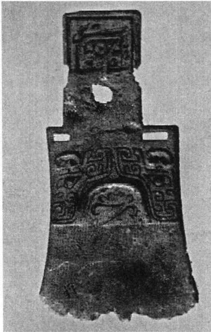
Abb. 3: Axtblatt des Typs Yue , 15.-14. Jh. v.u.Z., Bronze, B. 16.5 cm, ausgegraben 1980 in Luoshan, Kreis Tianhui, Provinz Henan. (Nach Kaogu Xuebao 1986.2, Taf. 7.1.)