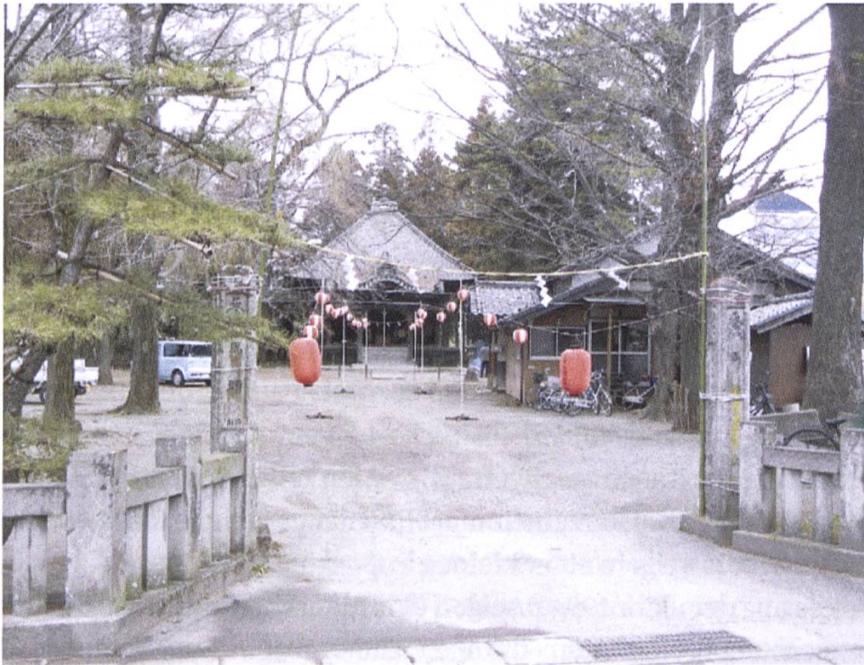
Abb. 3: Der Batō Kannon- dō von Minami-Ōrui unmittelbar vor dem Fest am 18. März 2013.

Wie sich während der Interviews herausstellte, scheint aber nicht nur das Interesse am Fest des Batō Kannon abzunehmen, sondern auch an den anderen anzan kigan -Dienstleistungen, die dort angeboten werden. Alle Befragten gaben an, während ihrer eigenen Schwangerschaften die Kerzenstummel verwendet zu haben und den o-sago in den Reis gemischt und gegessen zu haben. Auch als ihre eigenen Töchter und Schwiegertöchter schwanger waren, sorgten sie dafür, dass diese zumindest die Kerzen annahmen. Schon beim o-sago aber habe es Schwierigkeiten gegeben: Eine der Töchter habe diesen beispielsweise mit der Begründung abgelehnt, sie bekäme davon Bauchschmerzen. Überhaupt ließe sich die junge Generation kaum noch für die alten Rituale begeistern; der Grund dafür sei insbesondere in der Durchsetzung der Krankenhausgeburt zu suchen.