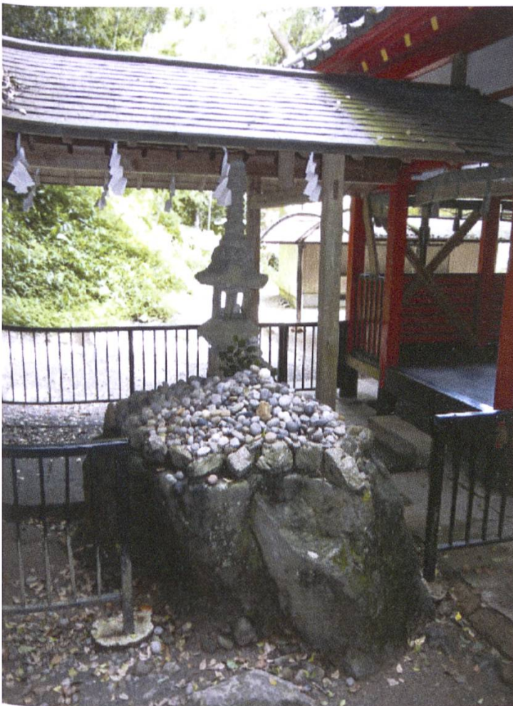
Abb. 6: Die Steine am Sekitai Jinja in Kagoshima.

Ehemännern, manchmal auch mit ihrer ganzen Familie anreisen, selbst bis zum Schrein durchgelassen werden könnten. In Ausnahmefällen könnten sie aber auch einen Vertreter oder eine Vertreterin vorschicken. Wie ein Blick in das vor dem Schrein am Opferstock ausliegende Gästebuch zeigt, in das sich alle Schreinbesucherinnen, die hier ihr anzan kigan durchführen, mit Namen, Adresse und geplantem Geburtstermin eintragen können, reisen die Besucherinnen aus ganz Japan, teils sogar aus Hokkaidō an. Der Priester des Kagoshima Jingū vermutet, dass es sich zumindest bei den sehr weit angereisten Besucherinnen um Frauen handelt, die ursprünglich aus der Region Kagoshima stammen und eigens für das anzan kigan in ihre Heimat zurückkehren. Das Gros der Besucherinnen jedenfalls stamme aus der Region Kagoshima selbst, höchstens noch aus anderen Regionen Kyūshūs. Der Schrein selbst mache keine Werbung für sein anzan kigan , die große Beliebtheit sei ausschließlich auf Mundpropaganda und vereinzelte Medienberichte zurückzuführen. Tatsächlich betonte der Priester während des Interviews mehrfach, der überregionale Besucherstrom sei von Seiten des Schreins