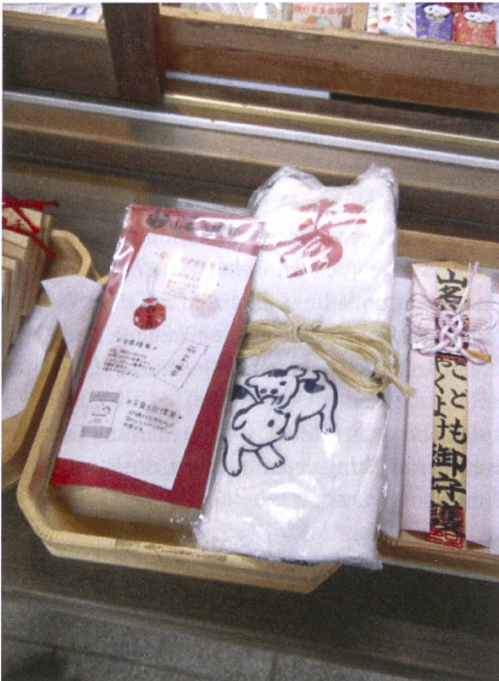
Abb. 4: Das anzan kigan -Set in der Auslage des Yamana Hachimangū.

Das zweite wird als Amulett für den hara-obi ( anzan hara-obi 安産腹帯, auch hara-obi o-mamori 腹帯御守り) bezeichnet. In der Gestaltung ähnelt es eher einem