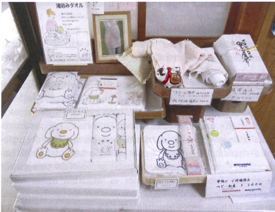
Abb. 1: Hara-obi und andere Gegenstände zum anzan kigan am Ōbara Jinja bei Kyoto.

genannt, bestand in den meisten Regionen aus einem bis zu fünf Meter langen Streifen aus gebleichtem Baumwollstoff ( sarashi 晒), den man fest um den Bauch der Schwangeren wickelte.