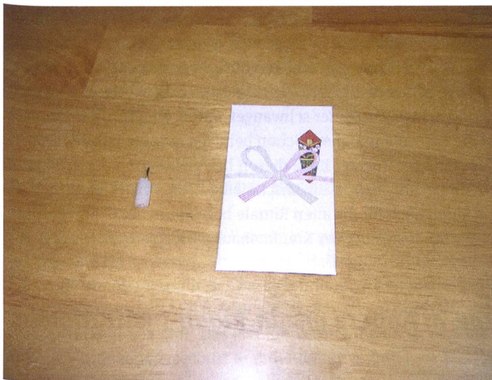
Abb. 2: Kerzenstummel und Reis des Batō Kannon in Minami-Ōrui.

Fotos des Festes aus dem Jahr 1994 54 zeigen eine Menschentraube, vornehmlich Kinder, die sich um Bretterbuden drängen, die vor dem Batō Kannon- dō aufgebaut sind und in denen Speisen und Getränke verkauft werden. Abb. 3 zeigt die Halle, wie sie sich mir fast 20 Jahre später am 18. März 2013 dargestellt hat.