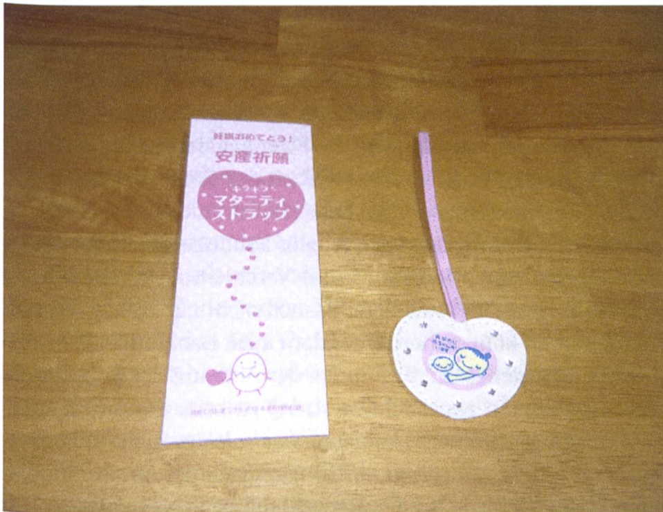
Abb. 8: „Maternity strap“ aus Hajimete no Tamago-Club und der dazugehörige Umschlag mit der Aufschrift anzan kigan .

kigan -Kugelschreibern auch anzan kigan -Bildschirmhintergründe oder animierte Bildschirmschoner zum Herunterladen.