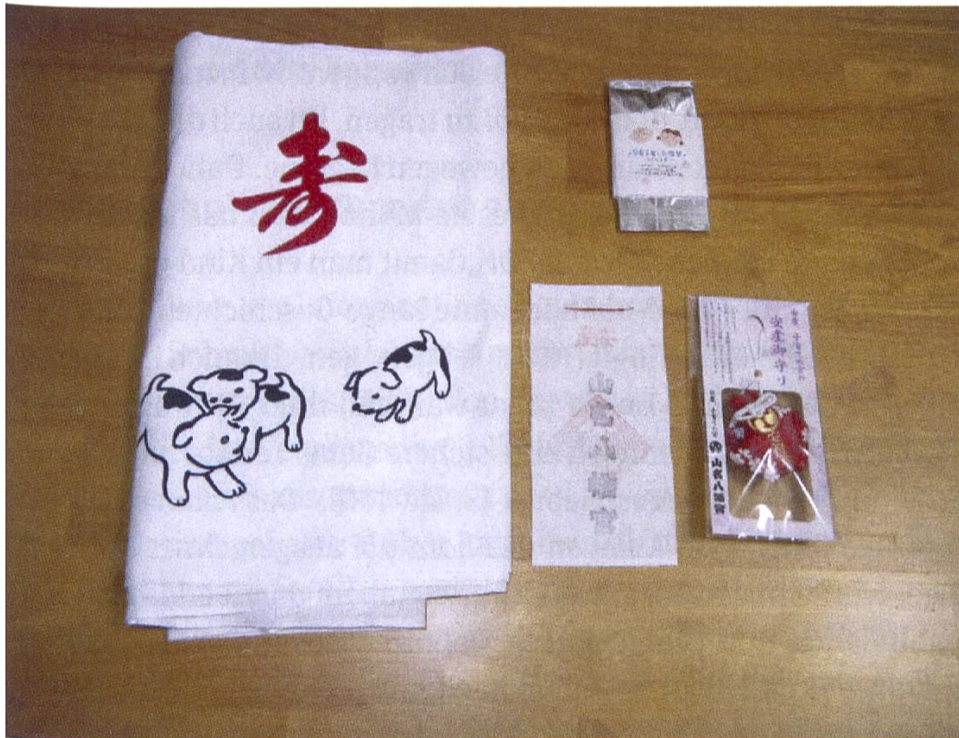
Abb. 5: Der Inhalt des anzan kigan -Sets des Yamana Hachimangū: Hara-obi , Tee, herkömmliches Schutzamulett, flaches Amulett für den hara-obi .

o-fuda (お札), einem Talisman aus Papier, ist aber aus weißem, grob geschnittenen 65 Stoff hergestellt. Es trägt den Namen des Schreins in schwarzer, die Schriftzeichen 安産 ( anzan , „sichere Geburt“) in roter Schrift, sowie, ebenfalls in roter Farbe, das Siegel des Schreins. Einmal täglich sei es mit der bedruckten Seite zur Haut auf den Bauch zu legen und dann dreimal mit der Hand zu überstreichen. Alternativ könne man es auch in den hara-obi stecken. Nach der gelungenen Geburt sei es am Schrein zurückzugeben.