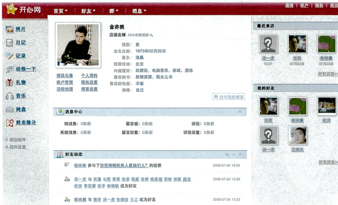
Illustration 1: Le Réseau Joyeux. Capture d'écran de ma page d'utilisateur. 24 juillet 2008 34 .