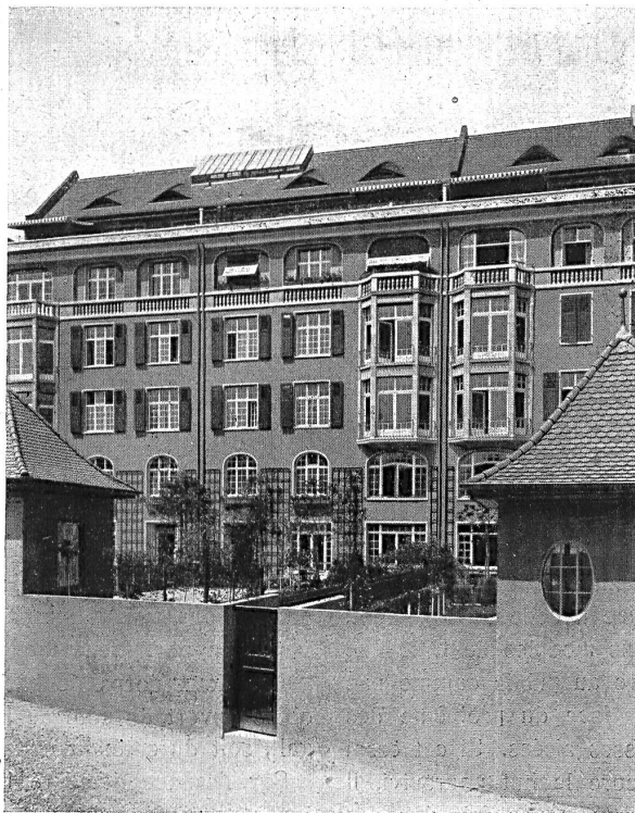
Groupe d'immeubles «Am Viadukt» :: Façade sur les jardins, Pelikanweg 3, 5, 7

L'idéal consisterait à réunir les avantages de ces deux genres d'habitation. Il faudrait pou-