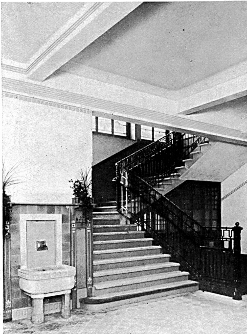
Vestibule au premier étage.

La sécurité que présente, en cas d'incendie, un bâtiment tel que le collège de Ruschlikon est