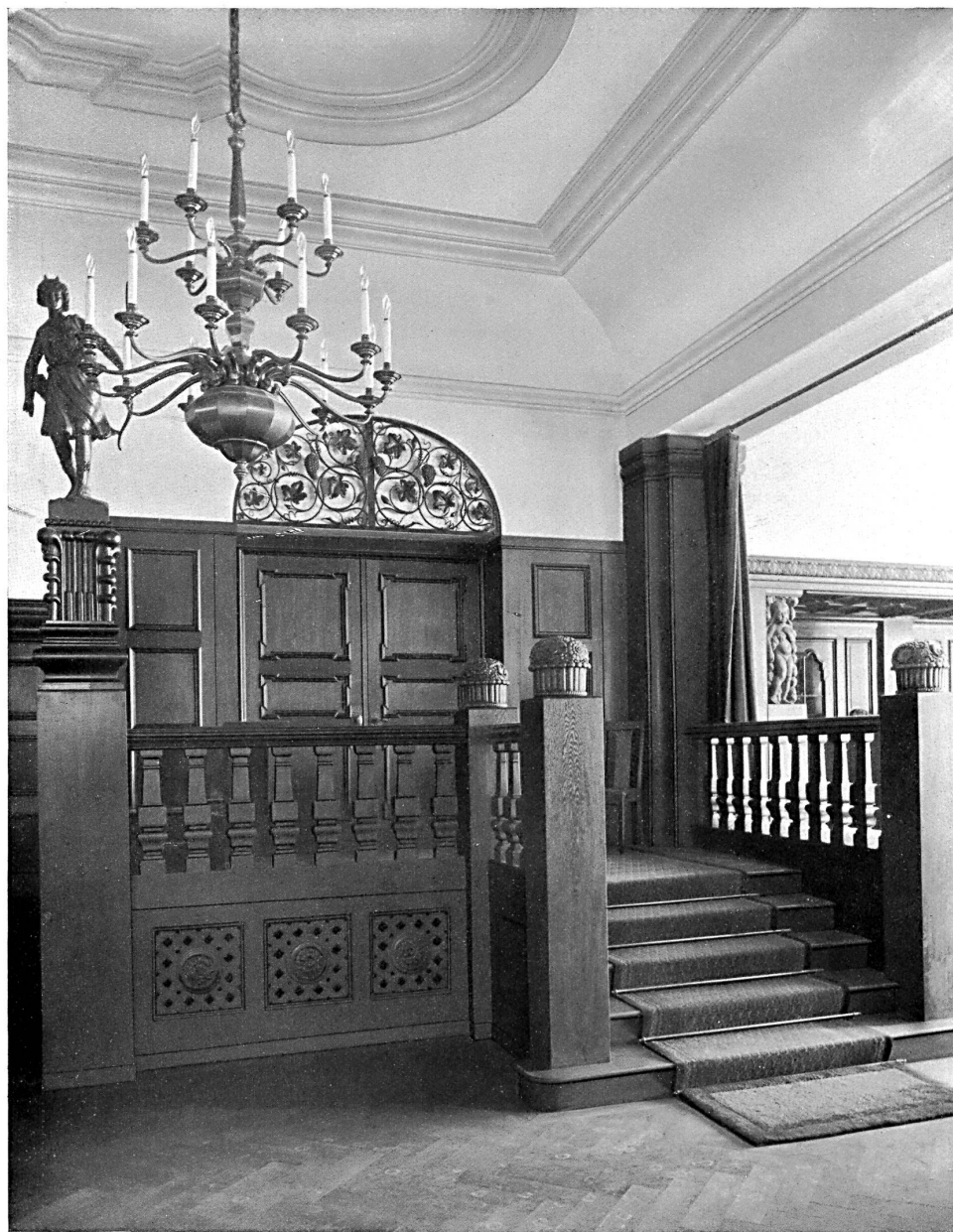
Partie de l'entrée du restaurant de l'Hôtel central, à Lausanne. — Architecte : J. Austermeier, Lausanne.