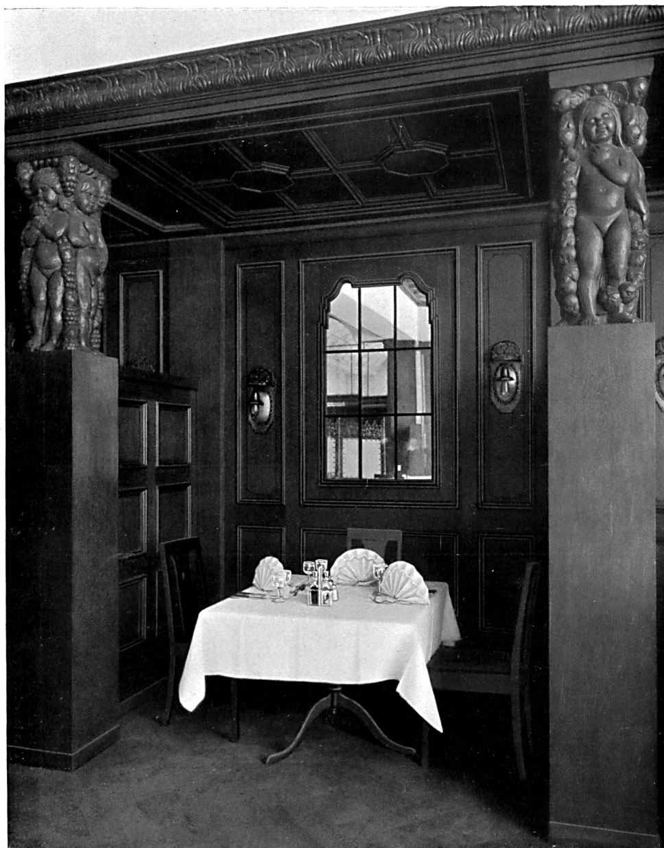
Hôtel central à Lausanne. — Niche dans le restaurant. — Architekt: J. Austermeier, Lausanne.

de 3 chambres à fr. 28000 soit environ fr. 34 par m 2 . Le loyer annuel d'un appartement de 2 chambres est calculé à fr. 438, celui d'un appartement de 3 chambres à fr. 510. La construction entière coûtera fr. 320000. Ce projet sera présenté au peuple dans la votation populaire du 5 juillet. Le conseil communal en recommande l'adoption et propose d'autoriser la municipalité à contracter un emprunt de fr. 320000 pour mener à bien cette entreprise.