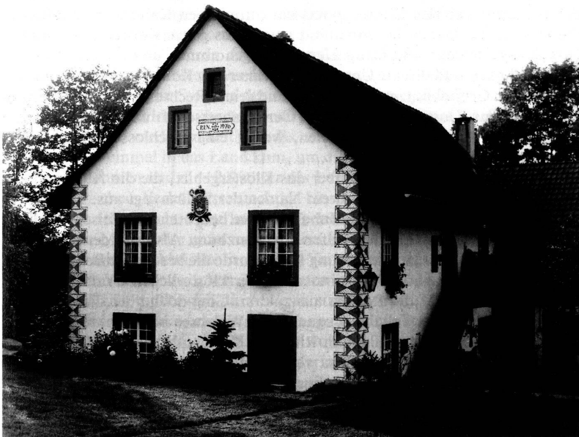
Renovierte Säckinger Fronmühle zu Kaisten, mit dem Wappen der letzten Fürststäbtissin von Säckingen

Am lebendigsten ist bis heute in Glarus die Erinnerung an die einstige Zugehörigkeit zum Kloster des hl. Fridolin in Säckingen geblieben. Bis zum Jahre 1395 gehörte die ganze Talschaft Glarus, fast das ganze Gebiet des heutigen Kantons, zu Säckingen 162 . Wann das Stift diesen Besitz erwarb, ist nicht mehr festzustellen. Er geht in sehr frühe Zeit zurück und dürfte wohl als königliches