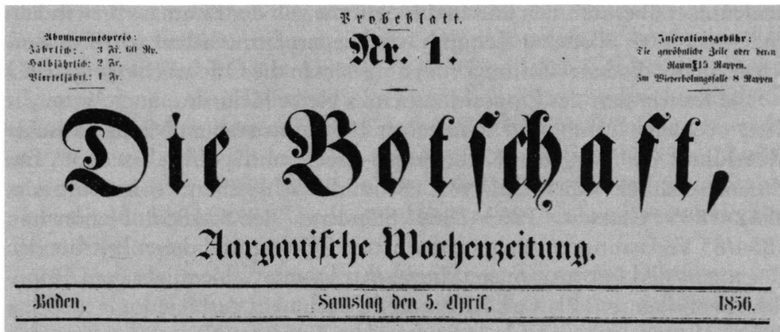
Probenummer der Botschaft vom 5. April 1856: Schleunigers neues Kampfblatt (Druckerei Bürl, Döttingen).

wie Rauchenstein, dann könnte man über eine paritätische Schule reden. 86 Leider müssen wir unsern Söhnen «missrathen». Sollte eine Kantonsschule in Baden entstehen, dann nur als katholische Schule. 87 In der Nummer vom 16. August 1856 erschien dann ein grosses Inserat der Klosterschule Mehrerau bei Bregenz.