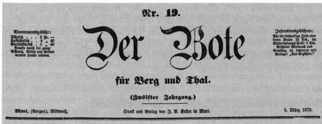
Titel des Boten für Berg und Thal aus dem Verlag Keller in Muri.