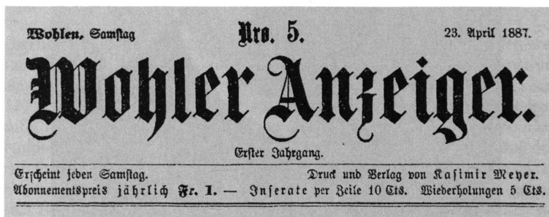
Kopf des Wohler Anzeiger vom 23. April 1887 (Druckerei Meyer, Wohlen).

Das Titelblatt bot nach wie vor unter dem Zeitungskopf eine reine Inseratenanlage, der Textteil war verschwindend klein und umfasste vor allem einen Redaktions-Briefkasten. Mit 1890 tritt der «Wohler Anzeiger» seinen vierten Jahrgang an, und Kasimir Meyer frohlockt: «Das Blatt hat sich während der kurzen Zeit ... zu einem Publikationsorgan emporgeschwungen, das zur Stunde gegen 1600 Abonnenten zählt und von Behörden und Privaten fleissig genutzt wird.» Dabei verkündete der Verleger stolz, dass sein Blatt, «ohne Politik zu treiben», «zu einer recht nützlichen und angenehmen