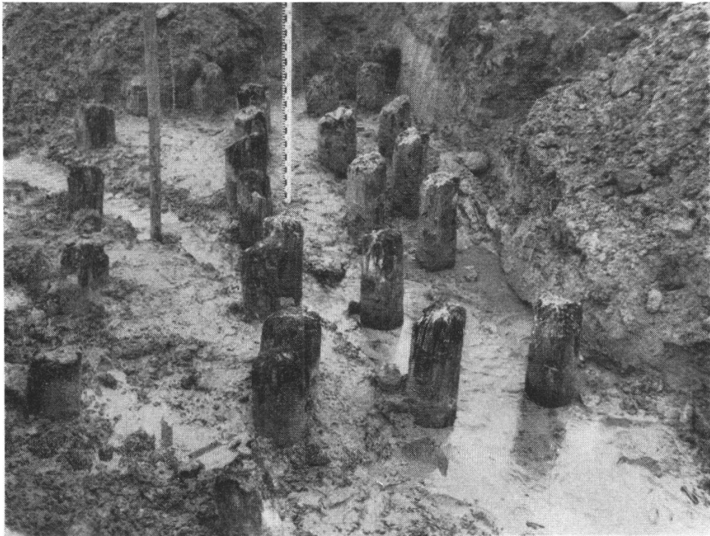
Pfahlwerk bei Bublikon

festgestellten Römerstrasse. In gleicher Flucht ist auch von Bublikon durch das «Lauberbach»-Tälchen gegen Mägenwil eine alte Strassentrasse sichtbar, die vielleicht ebenfalls auf die Römerzeit zurückgeht und in diesem Falle wohl als die Fortsetzung des vorgenannten von Stehlin bis an die Reuss festgestellten Strassenzuges anzusprechen ist. Da das Pfahlwerk vollständig im feinen Flußsande steht, könnte es sich demnach um den Strompfeiler einer römischen Brücke han-