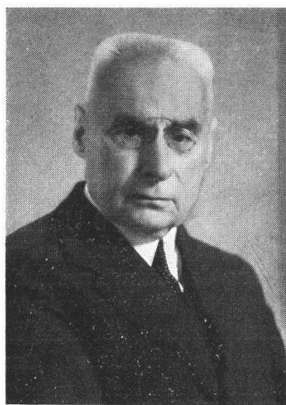
S. W. Brown 1865—1941

durchschnittlich 3,43 Personen, sodass also rund 25 000 Menschen direkt von der Arbeit des Unternehmens leben. Der ganze Konzern von Brown Boveri beschäftigt rund 40 000 Personen, eine Zahl, die auch die Bedeutung der Firma auf dem Weltmarkt unterstreicht.