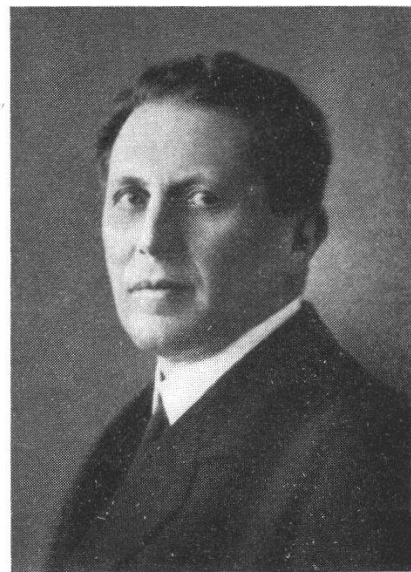
W. Boveri 1865—1924

eine ausgezeichnet geschulte Arbeiterschaft haben selbst in wirtschaftlichen schweren Krisenzeiten in ununterbrochenem technischem Aufstieg die Firma zu einem Weltunternehmen von grösstem Ansehen gemacht.