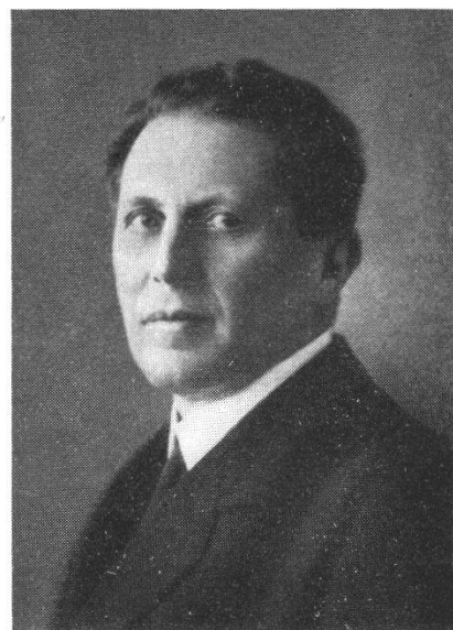
W. Boveri 1865—1924

eine ausgezeichnet geschulte Arbeiterschaft haben selbst in wirtschaftlichen schweren Krisenzeiten in ununterbrochenem technischem Aufstieg die Firma zu einem Weltunternehmen von grösstem Ansehen gemacht.