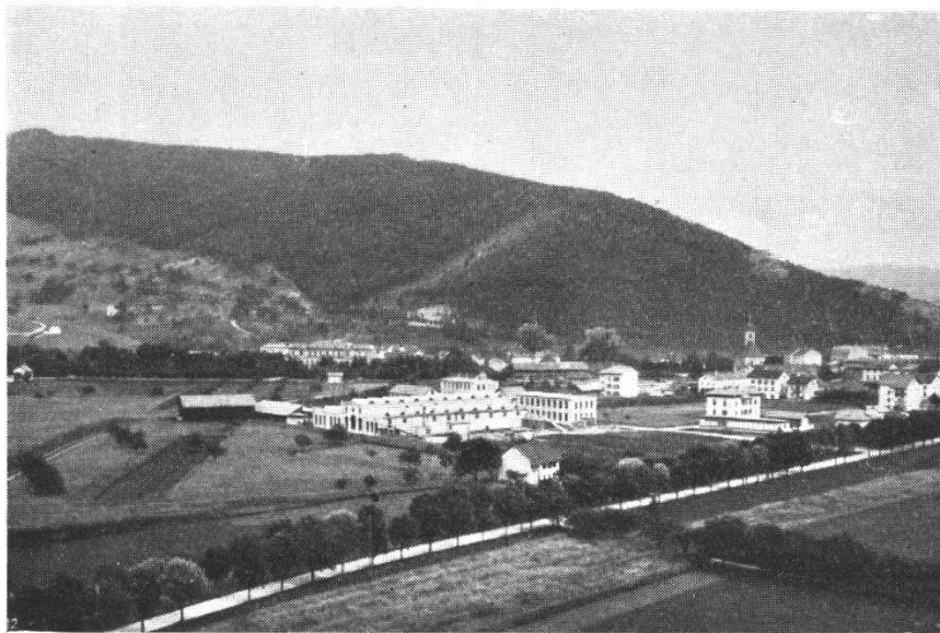
Die Fabrikanlage im Frühjahr 1894