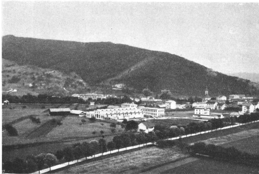
Die Fabrikanlage im Frühjahr 1894