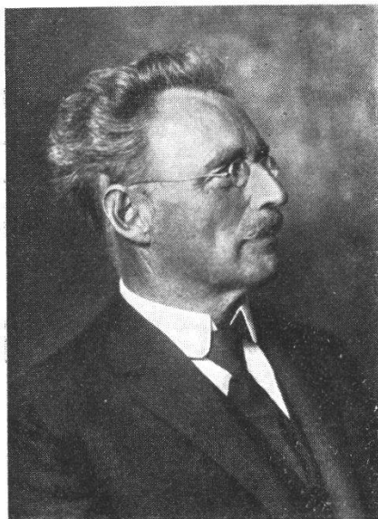
C. E. L. Brown 1863—1924

Es ist nicht möglich im Rahmen dieses Aufsatzes alle die technischen Pionierleistungen zu würdigen, welche die Firma in den ersten 50 Jahren ihres Bestehens hervorgebracht hat. Diese Leistungen tragen oft recht persönlichen Charakter, auf alle Fälle und bestimmt immer das Kennzeichen zäher Forschung, welche die Seele bildet. Hervorragende Männer und