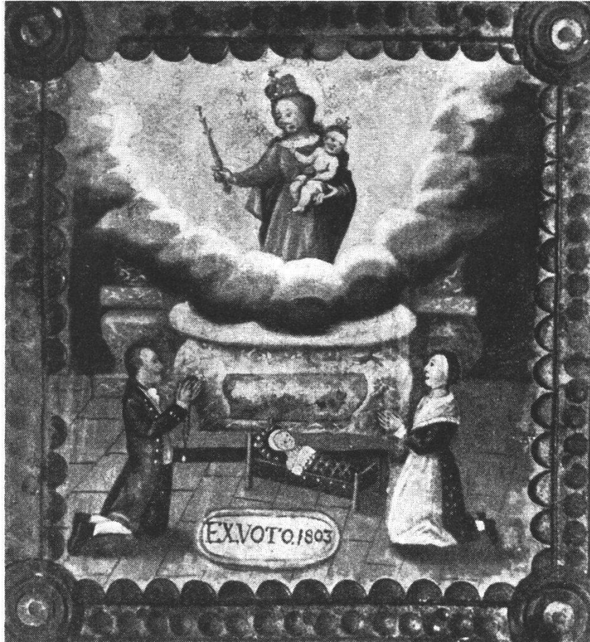
Votivbild von 1803 in der Wallfahrtskapelle Maria-Wil

dieselben kirchenhistorisch und volkskundlich bearbeiten zu können. Unsere Aufnahme hat Votivbilder in der Kapelle Maria-Wil bei Baden, in der Klosterkirche Wettingen und im Museum Baden (total ca. 15 Stück) und eine Votivgabe (Krücke) in der Kapelle auf dem Sulzberg bei Wettingen ergeben. Als Wallfahrtsort kommt Maria-Wil bei Baden in Frage.