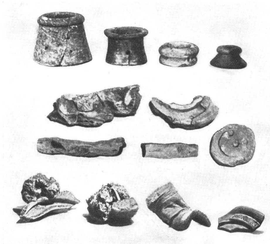
Römische Töpfereien in Baden: Brennständer, Brennwürste und Fehlbrandware