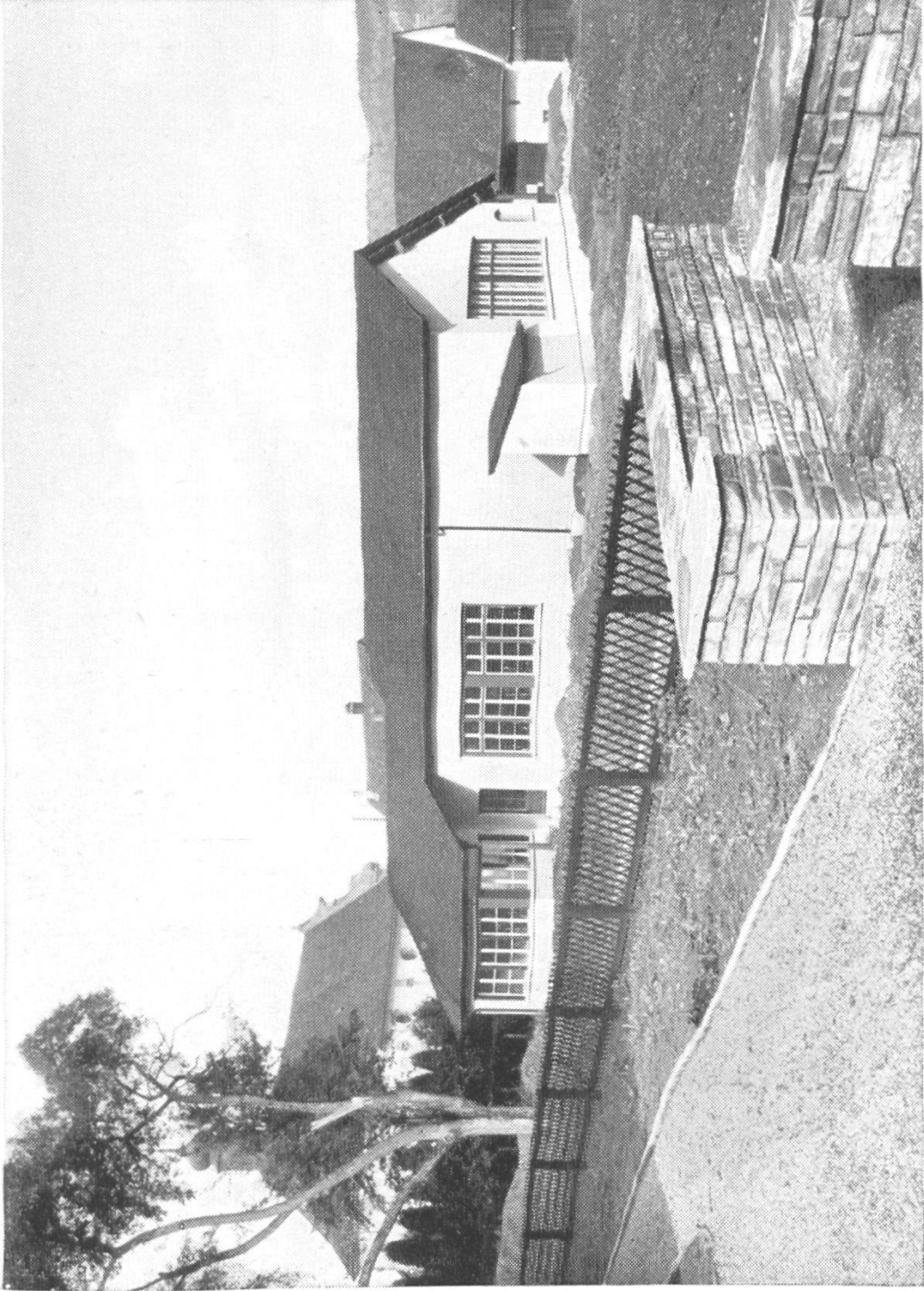
Schulhaus Kappelerhof, Südseite. Links Kapelle Mariawil