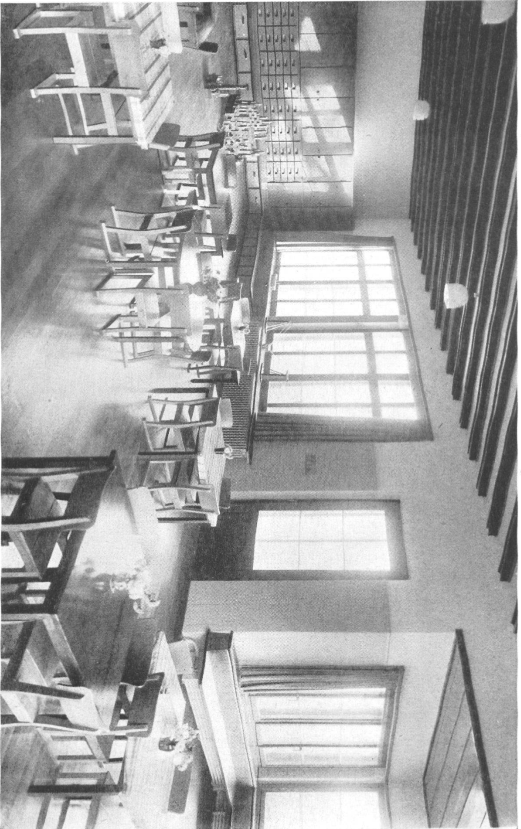
Innen-Ansicht des Kindergartens