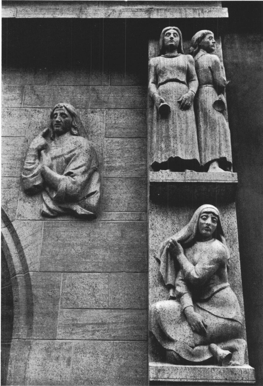
E. Spörri: Portal der Stadtkirche in Aarau. Details: Johannes und Törichte Jungfrauen.