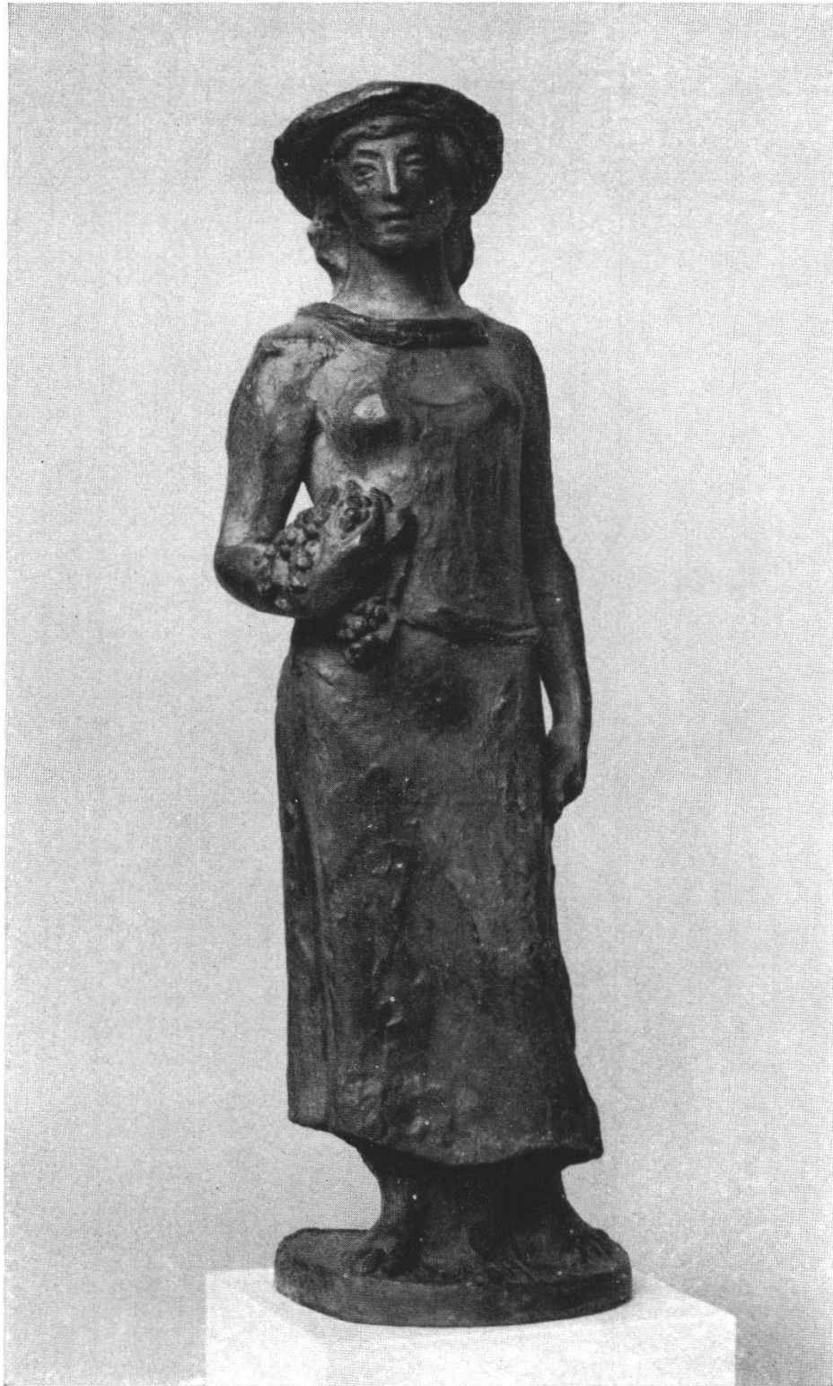
E. Spörri: Winzerin.