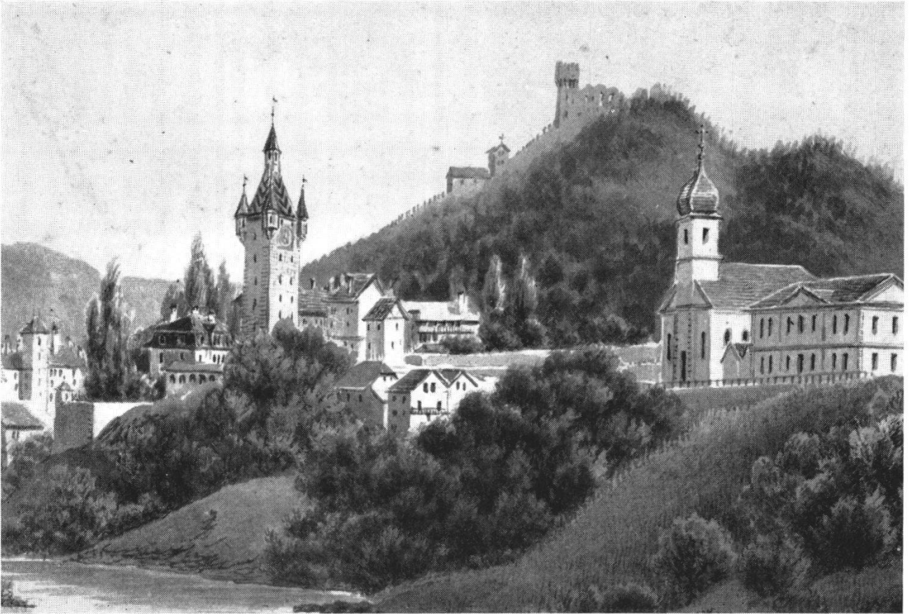
Abb. 3 Der Egloffstein im Jahre 1831. Originalgouache von J. Dubois. Diese Ansicht zeigt den Egloffstein kurz nach seiner Erbauung. Die Limmatpromenade besteht noch nicht; sie wurde 1832 eingeweiht.