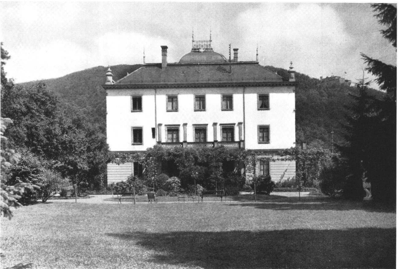
Abb. 9 Der Egloffstein nach dem Umbau um 1900. Am Haus sind beim ersten Stock noch die Pilaster des alten Egloffstein erkennbar. Der Säulenvorbau dürfte aus den 70er Jahren stammen. Die Aufnahme besticht besonders durch die prachtvolle Weiträumigkeit des Parkes.