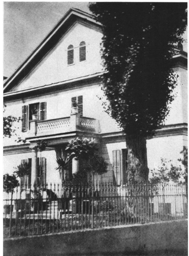
Abb. 7 Der Egloffstein um 1875. Die Photographie zeigt die Südseite des Hauses. Der Säulenvorbau mit Balustrade dürfte aus dieser Zeit sein.