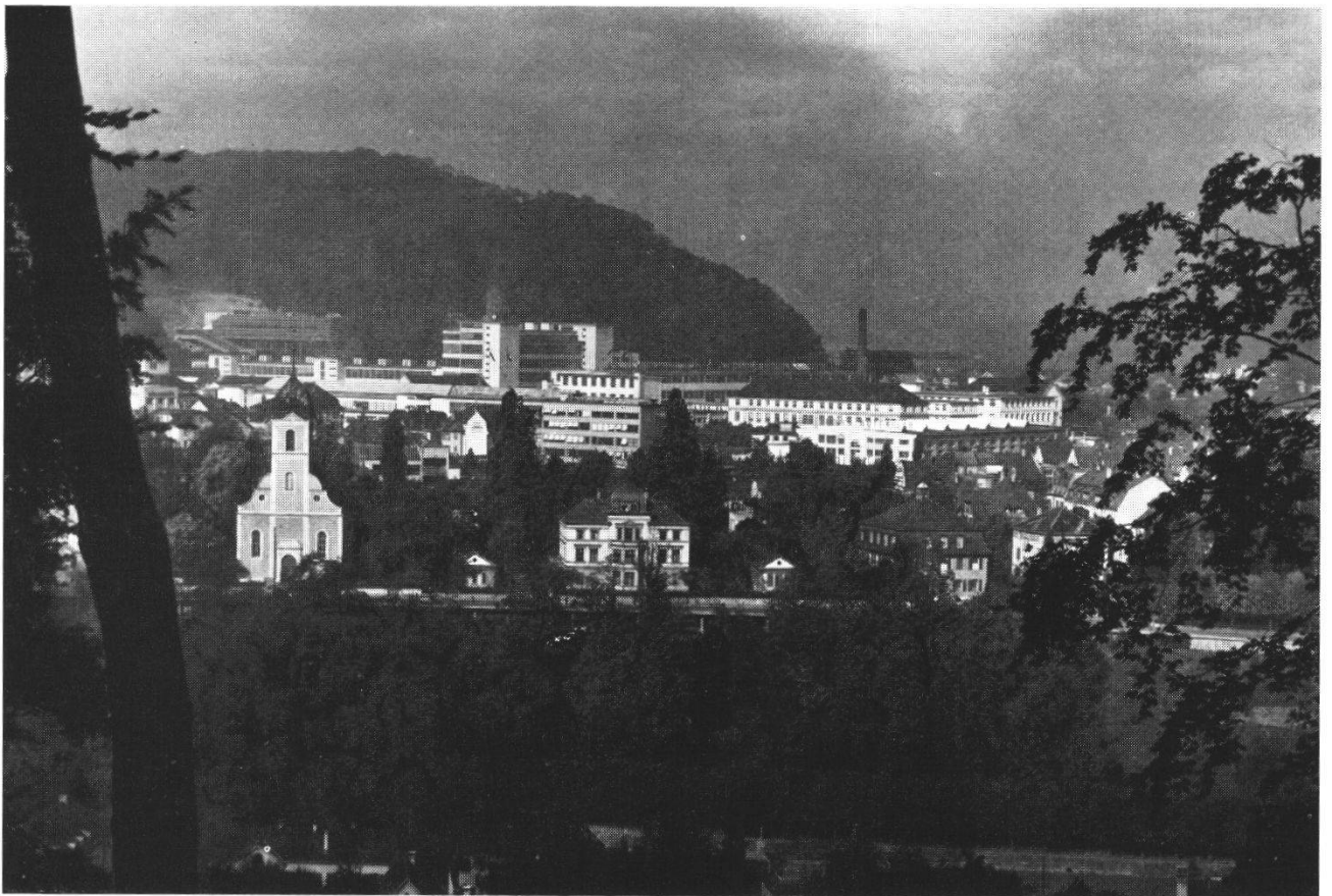
Abb. 2 Der Egloffstein und seine Umgebung um 1957. Der Egloffstein ist zwar umgebaut, aber die beiden Seitengebäude und der Park erinnern noch an die Vergangenheit. Wie eine Vision der neuen Zeit ragen im Hintergrund die Fabrikbauten des neuen Baden empor.