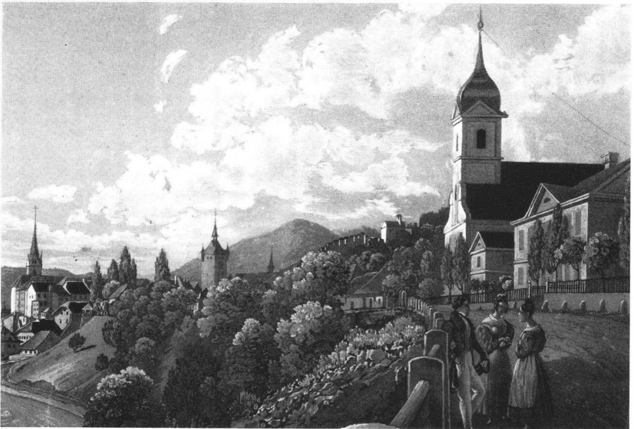
Abb. 4 Der Egloffstein um 1840. Ausschnitt aus einem Aquatintastich von J. Speerli nach einer Zeichnung von J. Mayer-Attenhofer. Man erkennt deutlich, daß die Seitengebäude ursprünglich zweistöckig waren.