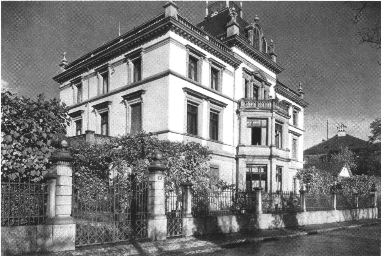
Abb. 8 Der Egloffstein nach dem Umbau um 1900. Das Haupthaus und die Garteneinfriedung sind völlig verändert. Der durch Robert Dorer erfolgte Umbau atmet den Geist des Jugendstils.