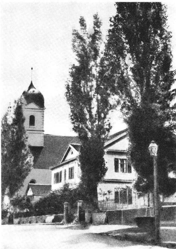
Abb. 6 Der Egloffstein um 1875. Die Photographie zeigt die Ostseite des Hauses. Besonders eindrucksvoll sind die Pappeln.