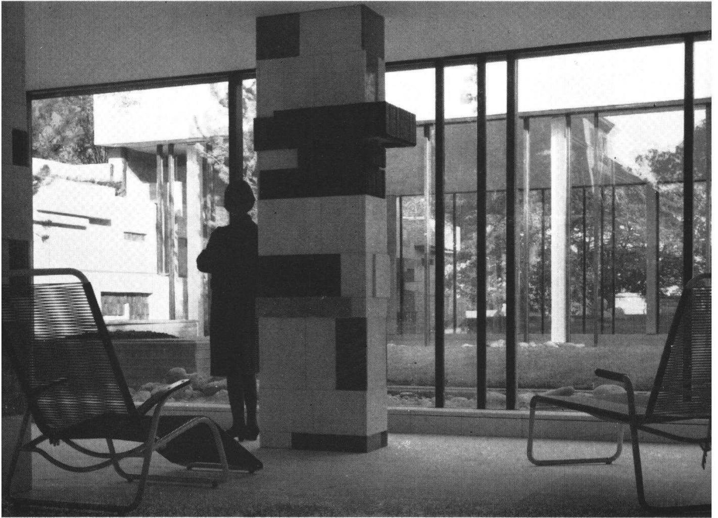
Vorne: Liegehalle; Mitte: die im Sommer offene Liegewiese; Hinten: Schwimmbassin