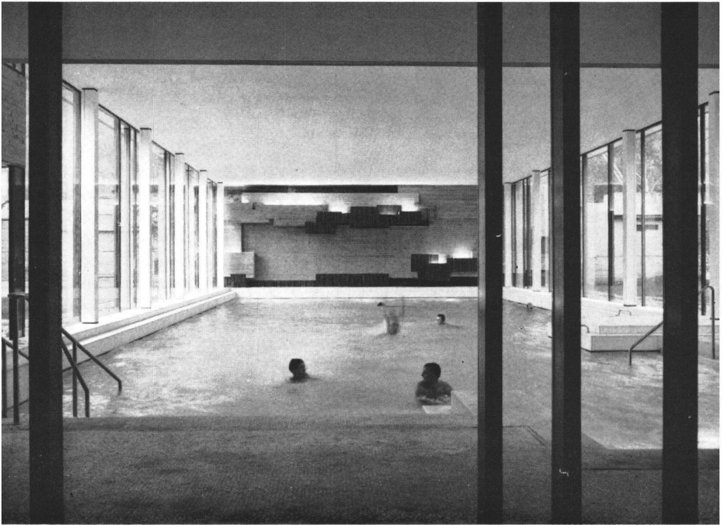
Blick vom Entrée auf das Schwimmbassin (11 x 24 m)