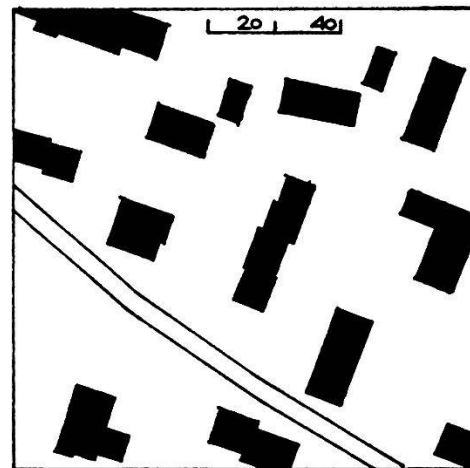
Wohnüberbauung Siggenthal Offene Bauweise

Gegenüberstellung der geschlossenen und offenen Bauweise. Beim Beispiel rechts, stellvertretend für viele neuere Wohnüberbauungen, entsteht keine spürbare Raumbildung.