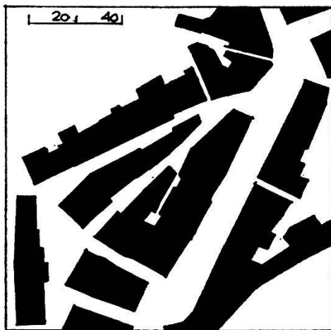
Altstadt Baden Geschlossene Bauweise

Die starke Verkehrszunahme in den letzten Jahrzehnten hat nicht nur zu einer Erweiterung der Verkehrsfläche geführt, sondern auch die Siedlungsplanung wesentlich beeinflusst. Nicht von ungefähr steht bei der Planung von Wohnsiedlungen die Ausarbeitung von Überbauungsplänen im Vordergrund, die mittels Baulinien die notwendigen Bereiche für die Erschließung sicherstellen. Dadurch entstehen oft zu gross dimensionierte, zweckentfremdete Freiflächen und zusammenhanglose Überbauungen.