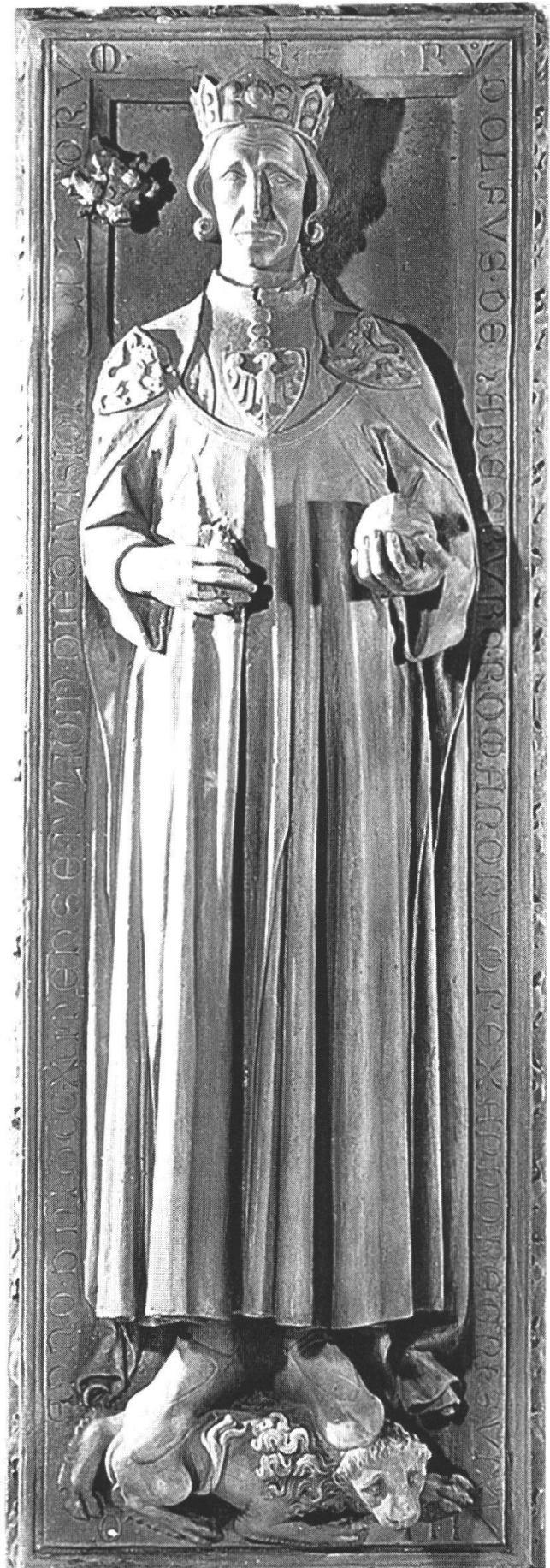
Grabmal des Königs Rudolf von Habsburg in der Krypta des Doms von Speyer. Das schlichte Gewand ist an den Schultern mit dem Habsburger Löwen geschmückt, auf der Brust trägt er das Reichswappen, den Adler.