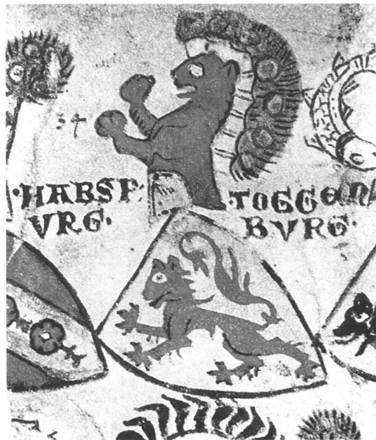
Wappen der Kyburger und Habsburger nach der Zürcher Wappenrolle, um 1335/40.