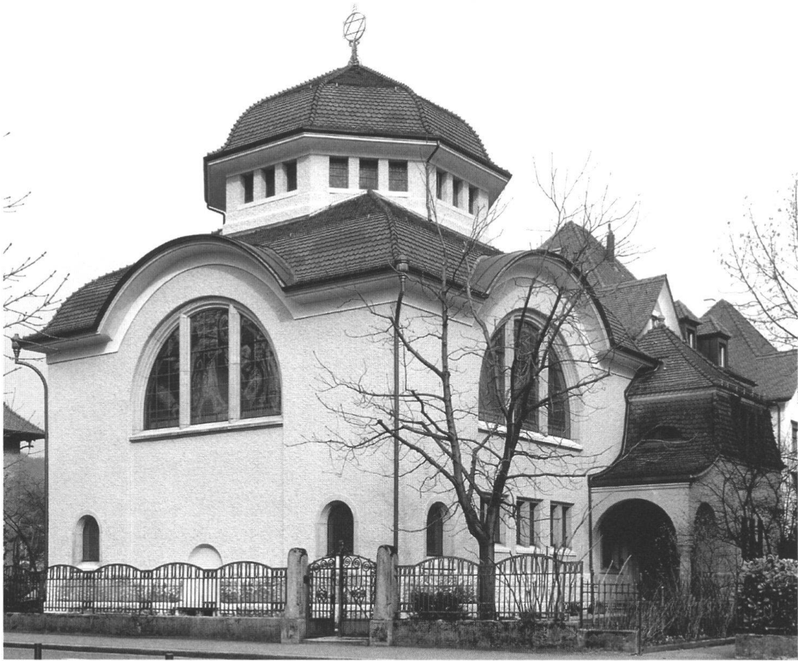
Die Synagoge von 1913 an der Parkstrasse.