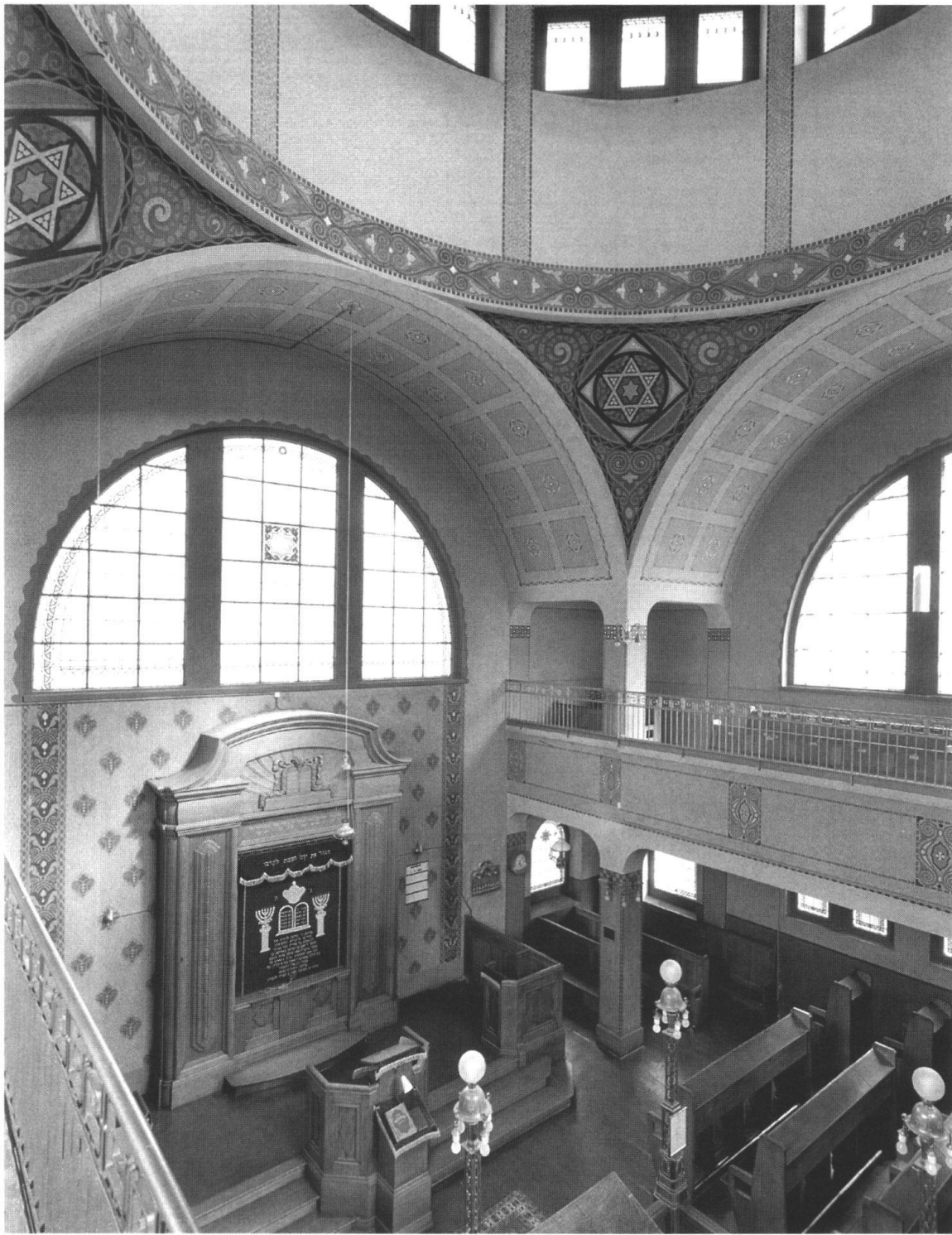
Innenraum der Badener Synagoge.