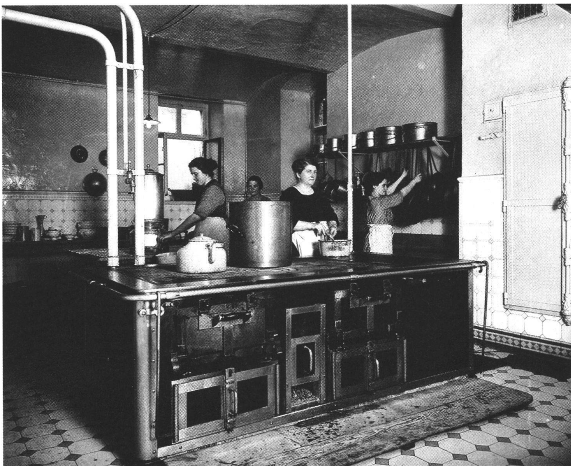
Küche im Hotel Schwanen um 1924. Arbeitsstellen, die eine spezialisierte Tätigkeit, wie hier die Arbeit als Köchin, ermöglichten, waren sehr gesucht, weil sie einerseits besser bezahlt waren und andererseits auch eine geringere Belastung bedeuteten.