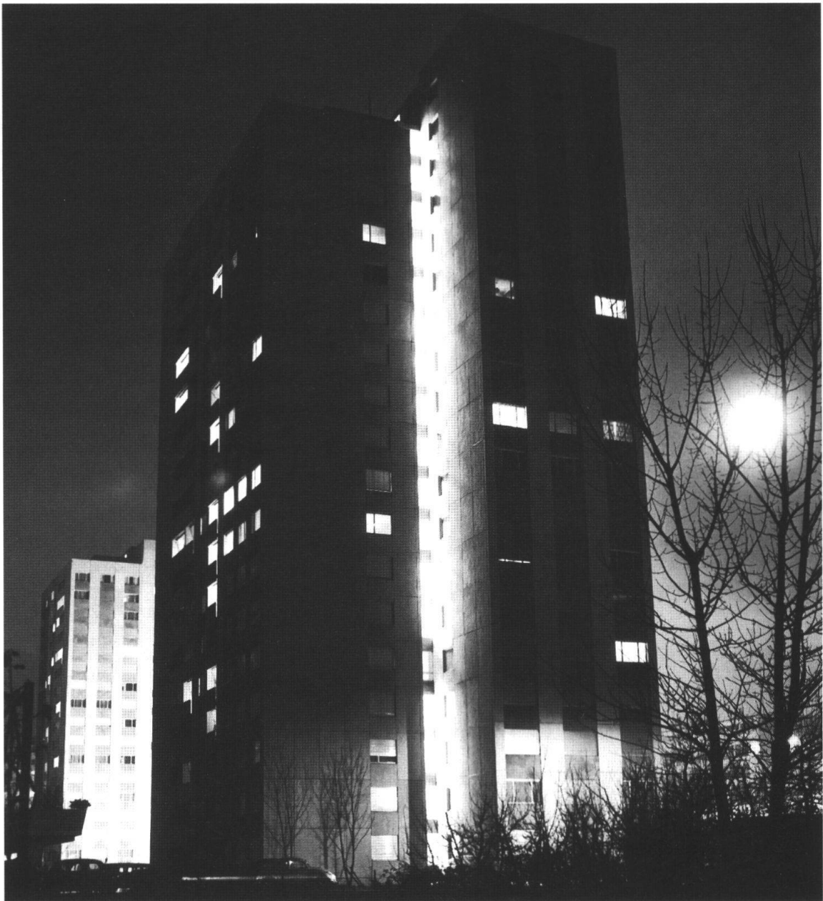
Wettingen by Night. Im Vordergrund eines der drei Wohnhochhäuser im Zentrum der Stadt.