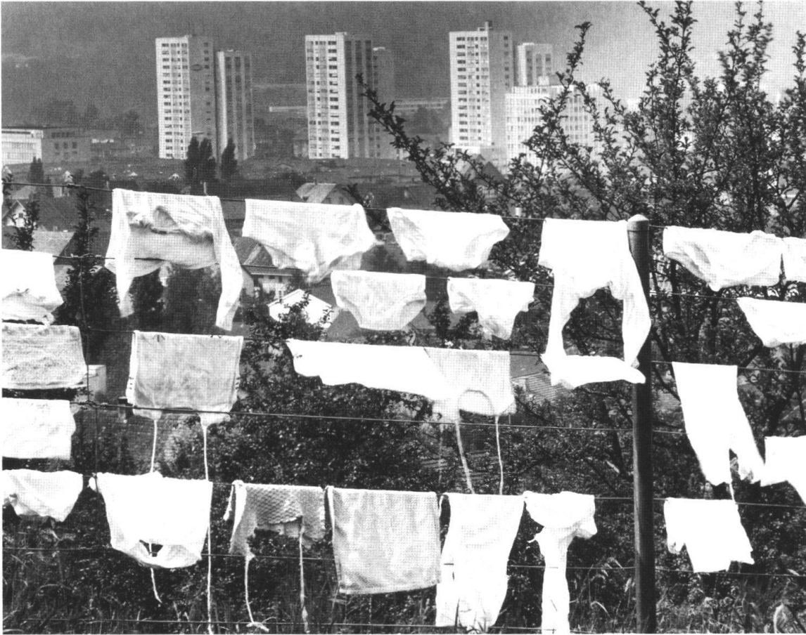
Die drei Hochhäuser im Zentrum von Wettingen, Mitte der 1960er-Jahre. Wer eine Wohnung im Hochhaus bezog, konnte die Wäsche nicht mehr im Garten trocknen lassen, hatte dafür aber eine grossartige Aussicht.