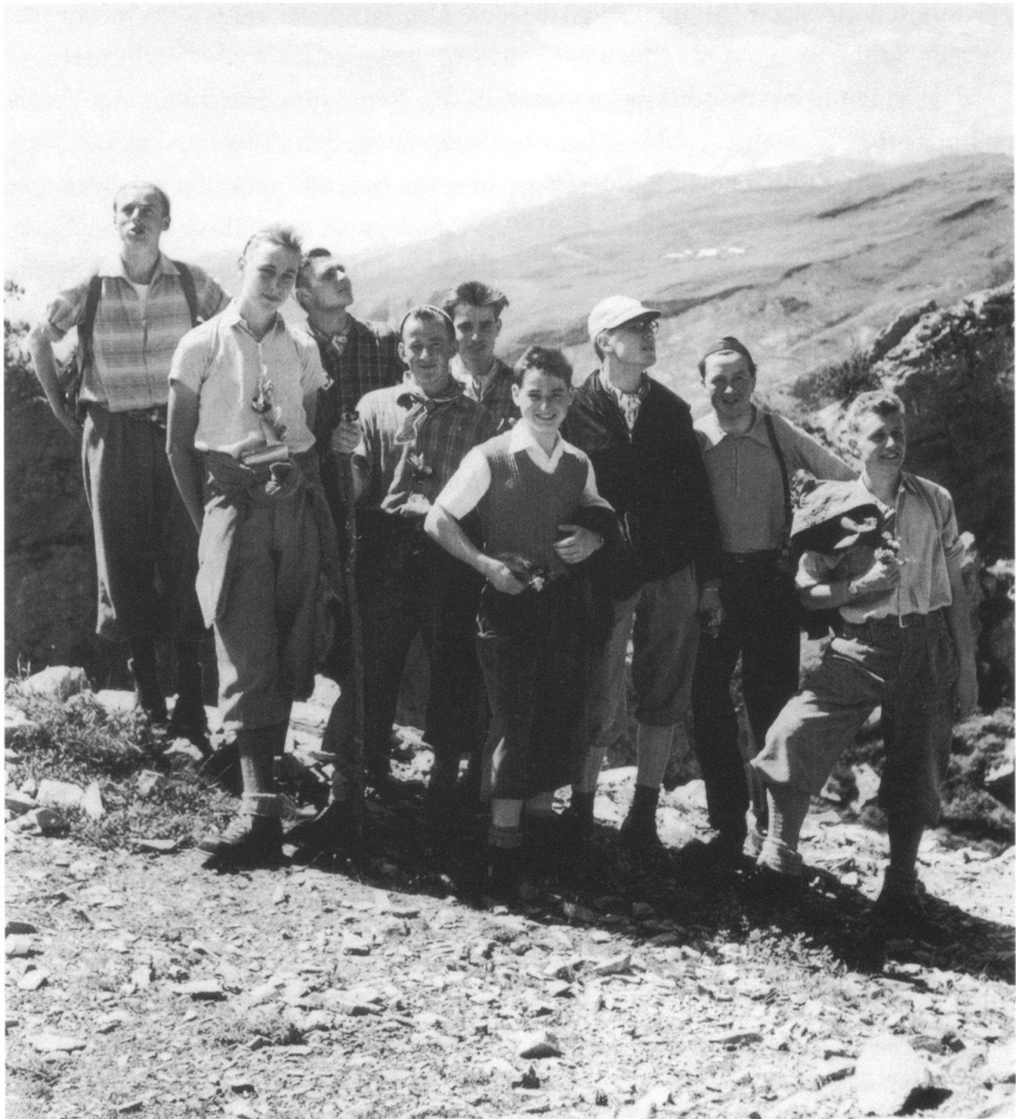
Höhepunkte aus dem Juma- Jahr: Ferienlager auf der Alp Bargis bei Flims 1956.