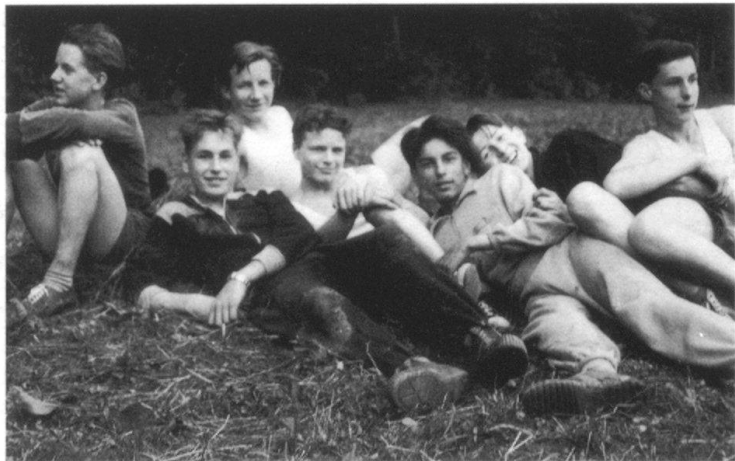
Höhepunkte aus dem Juma- Jahr: Posieren auf der Greppenwiese an der Juma- Olympiade 1956.