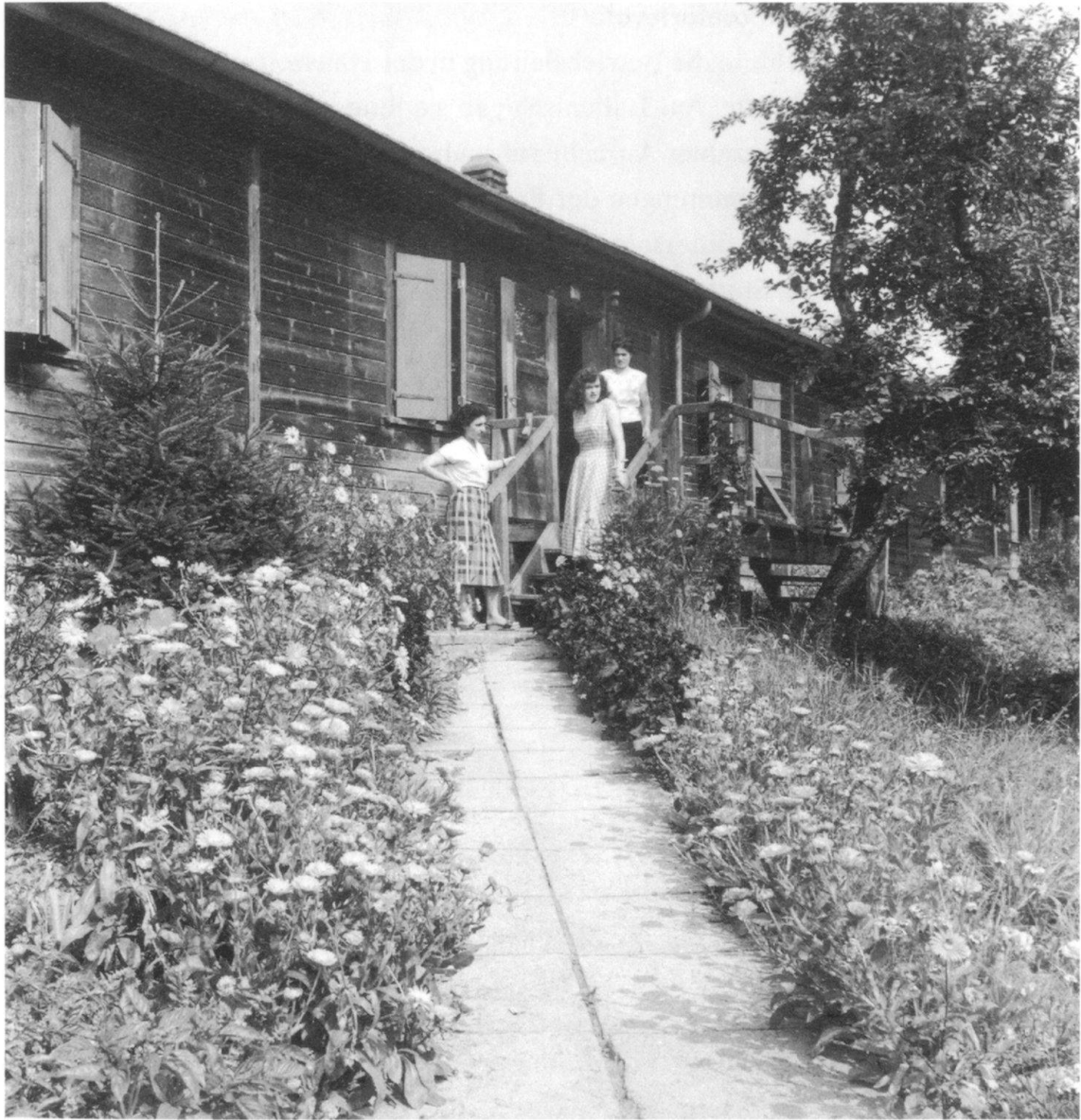
Drei italienische Arbeiterinnen vor ihrer Wohnbaracke in Rieden, um 1950. Die Unterkunft mit Blumenwiese präsentiert sich als bescheidene Idylle.