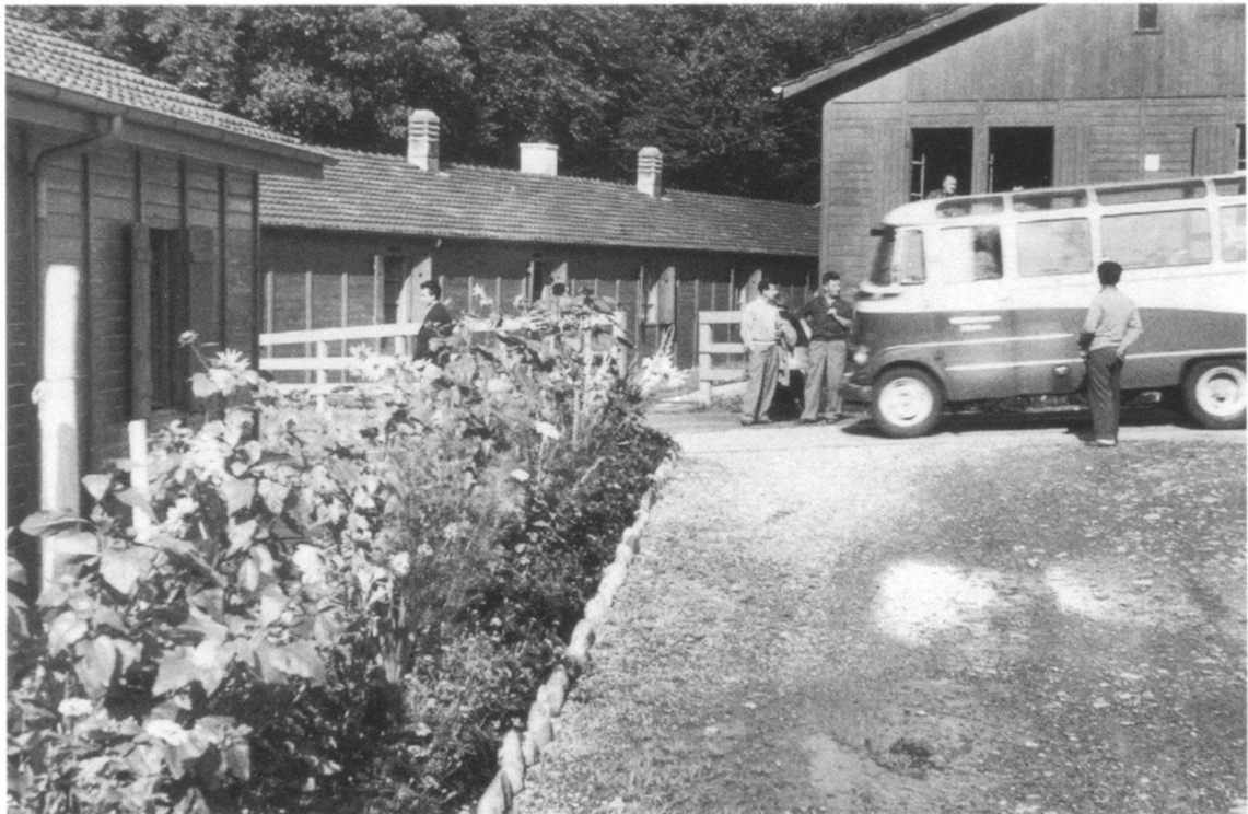
Die Barackensiedlung im Brisgi für allein lebende aus- ländische Arbeiter um 1960 (Foto Valentin Janett, Ge- meinde Wettingen).