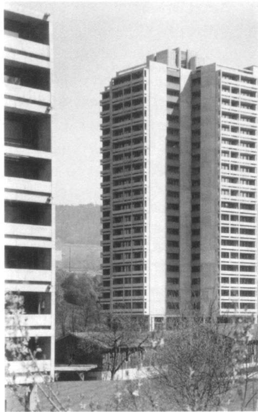
Baracken aus den 1940er-Jahren und Hochhäuser der 1960er-Jahre standen in der Brisgi-Siedlung nahe bei-sammen.