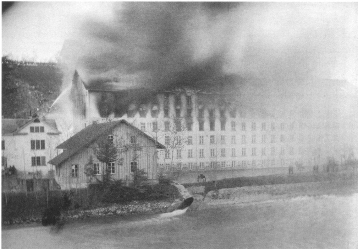
Die Spinnerei Spoerry im Vollbrand. Links das Fabrikantenwohnhaus und, in Holz, das Turbinenhaus am Kanal. An der Böschungskante eine dichte Zuschauermenge, vom Hang aus wird gespritzt.