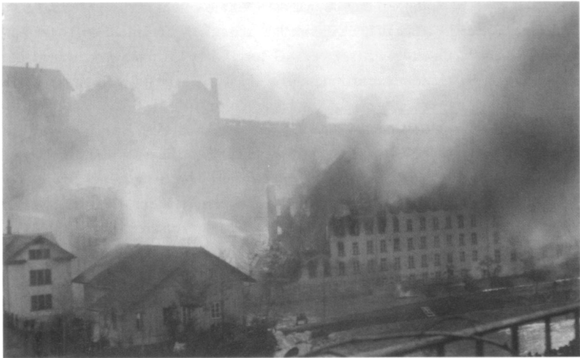
Die Spinnerei beim oder kurz nach dem Einsturz der nördlichen Gebäudehälfte. Weiter rechts klatscht ein brennender Balken in den Fabrikkanal. Die Feuerwehr ist chancenlos.