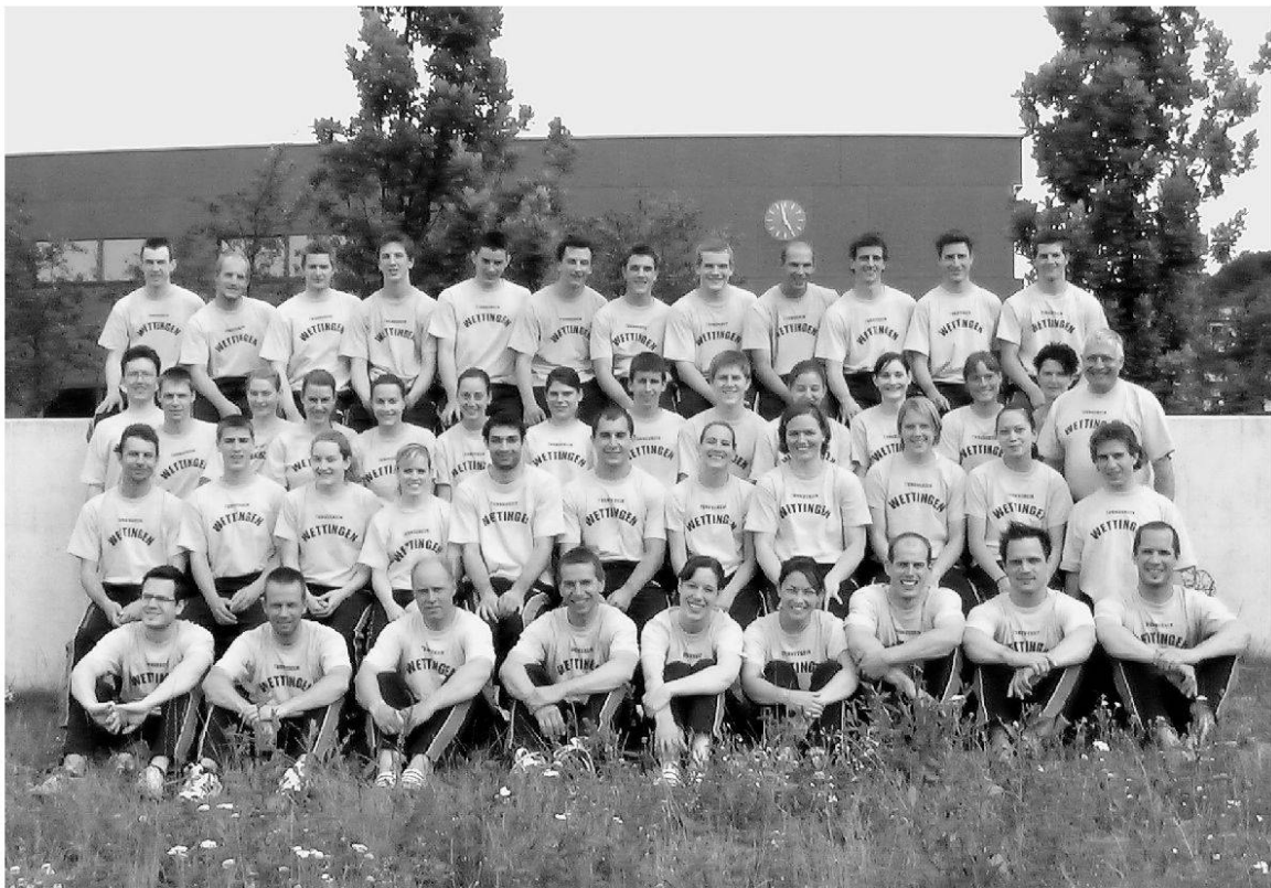
Gruppenfotos 1984 und 2004.