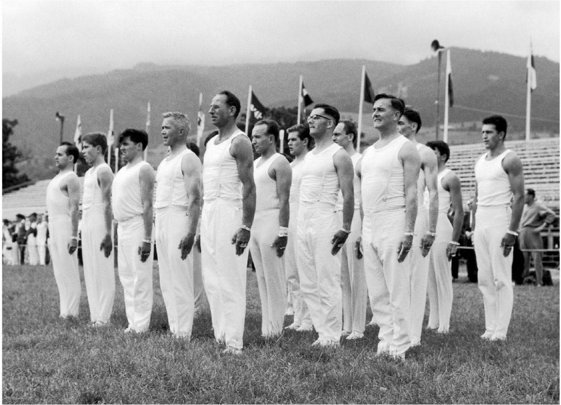
Eidgenössisches Turnfest in Luzern 1963.