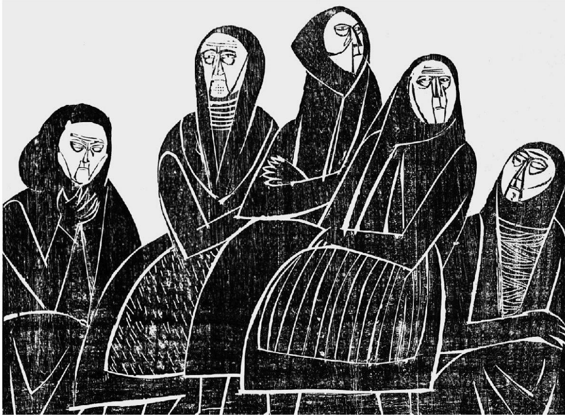
Fünf alte Frauen 1973, schwarzweisser Holzschnitt, 59 x 79 cm.

Reduzierte Gegenständlichkeit, erzählerischer Duktus und symbolische, mythische Kraft zeigen sich auch in den Holz-