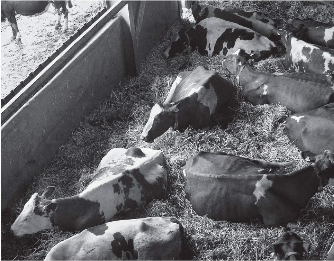
Die Herdenrangordnung bildet sich im Liegen aus – Milchkühe in Tiefstroh-Freiluftstallhaltung.