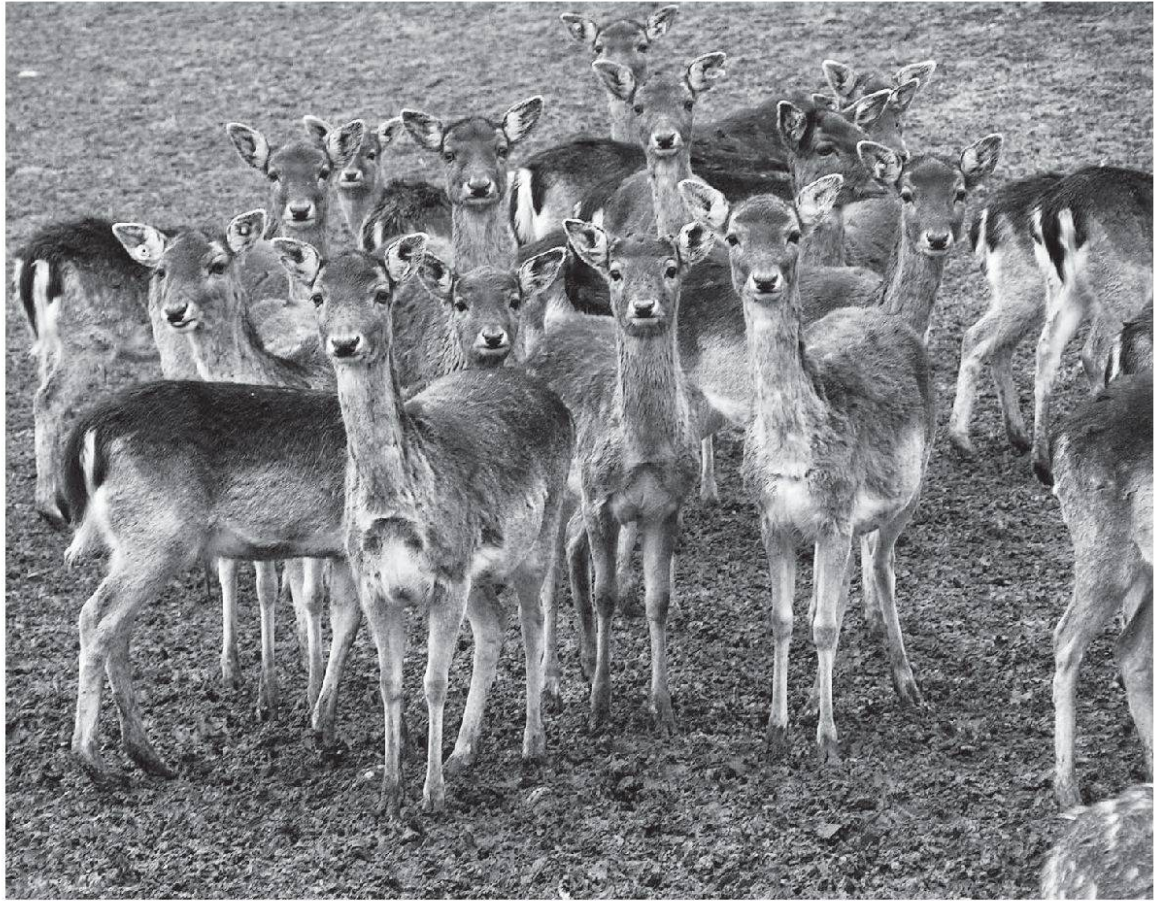
Immerzu wachsam – Damhirsche auf dem Wettinger Mooshof.