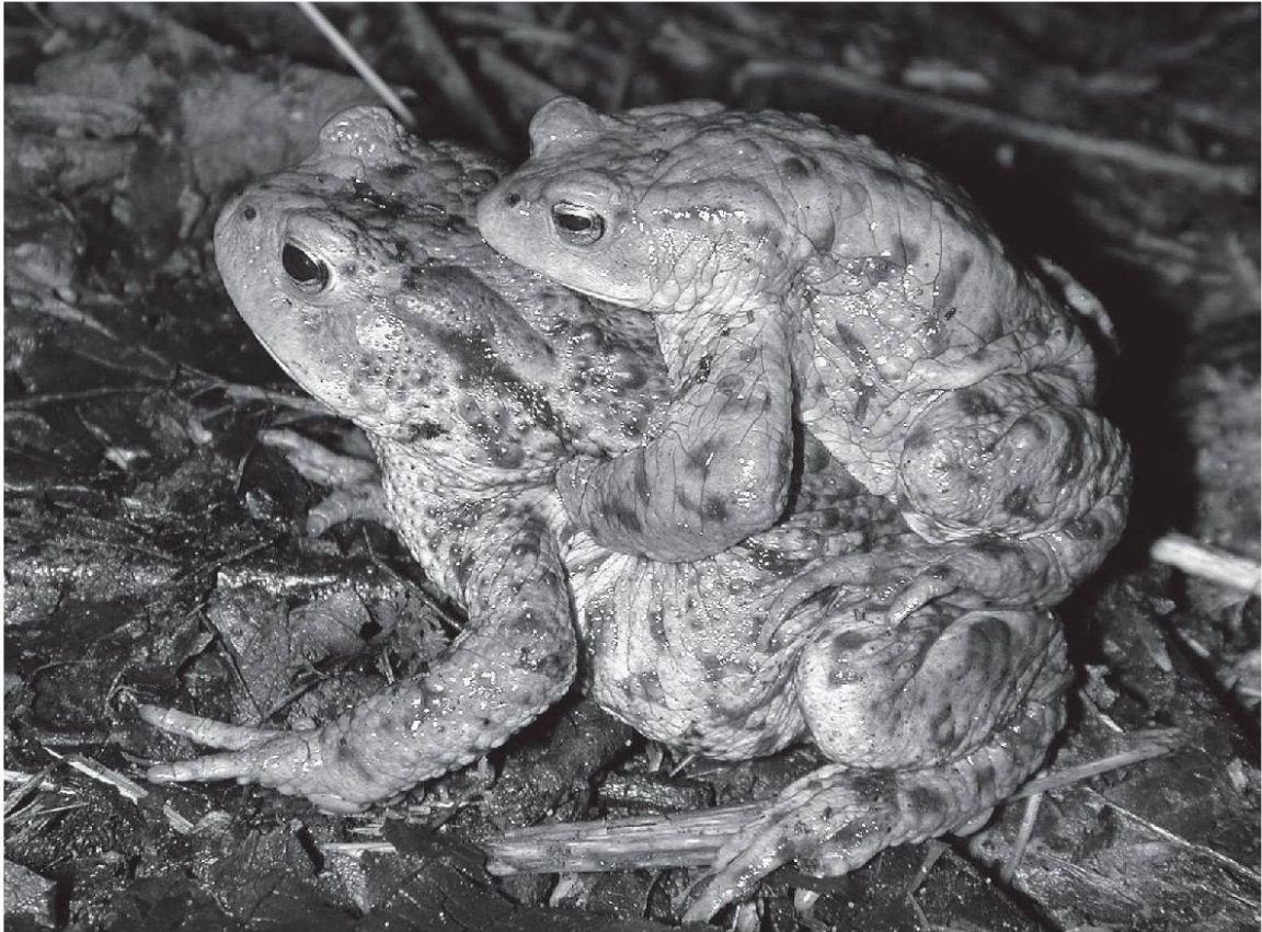
Wanderndes Krötenpärchen, das Weibchen trägt das Männchen.