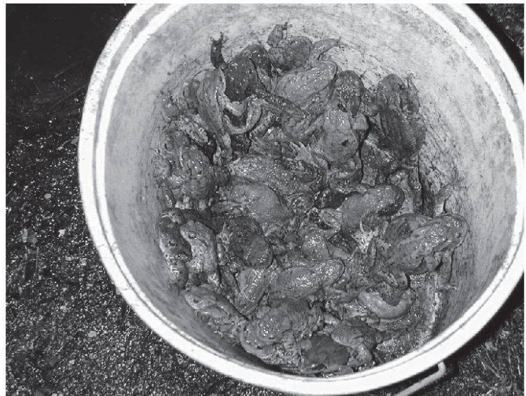
An der Mellingerstrasse aufgelesene Erdkröten.