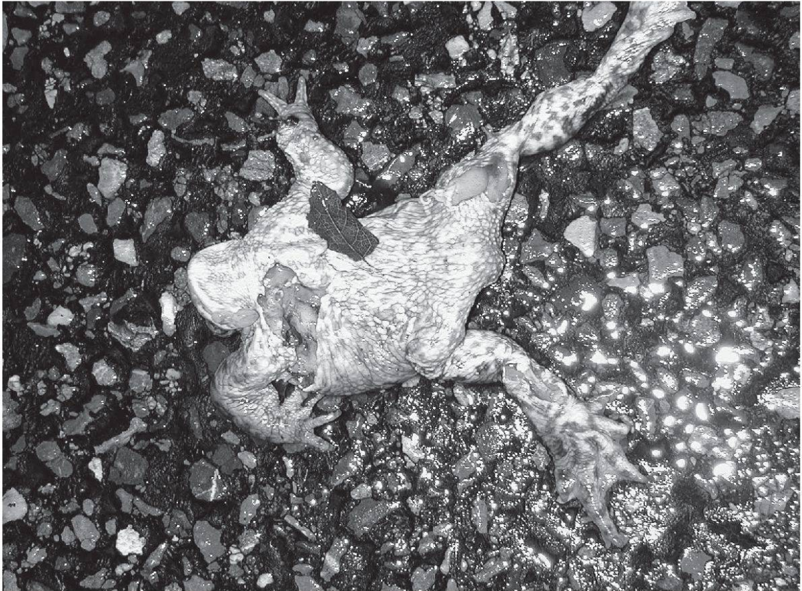
Strassenopfer auf der Dättwilerstrasse.