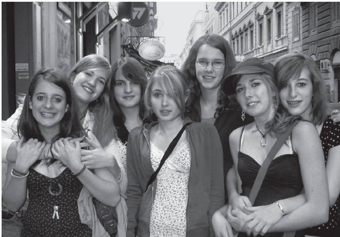
Besuch beim Papst: Eine Gruppe junger Frauen posiert in einem Römischen Corso.