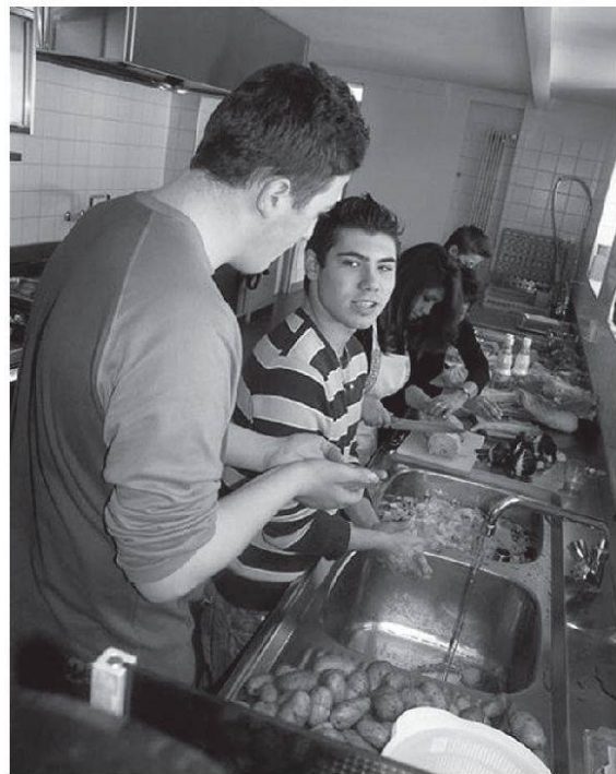
Gemüse schnetzeln: Die Jugendlichen vom «Weissen Keller» helfen beim Mittagstisch der reformierten Kirche mit (Foto: Alex Braun).