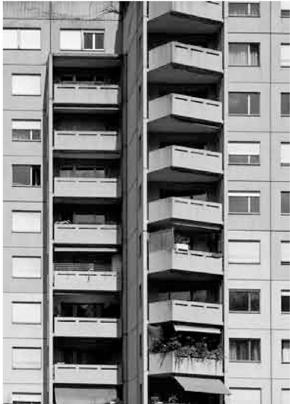
Abb. 1: Schreckgespenst oder Traumwohnung? Die Geister scheiden sich an Siedlungsprojekten wie demjenigen der Webermühle.