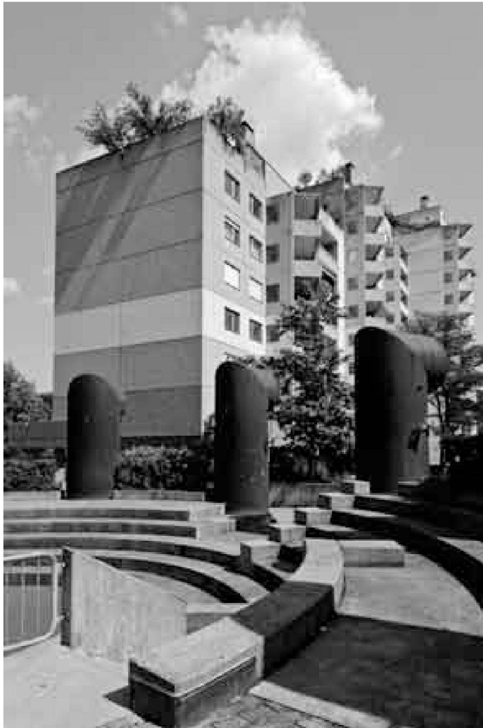
Abb. 4: Die Arena als Ort der Begegnung in der Mitte der Anlage. Die Entlüftungsrohre der Tiefgarage können als Metapher für einen Hochseedampfer gelesen werden: Maschinenästhetik für die Wohnmaschine?