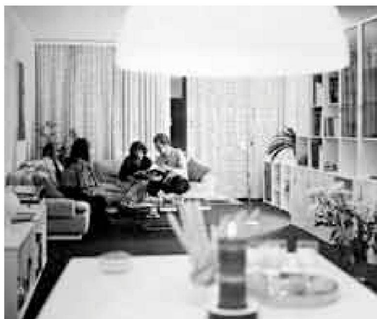
Abb. 12: Detaillierte Werbe- prospekte und Musterwohnungen, die täglich besichtigt werden konnten, dienten der Vermarktung der Webermühle. Die Badener Firma «Form +Wohnen» richtete eine Musterwohnung ein und warb dafür mit einem eigenen Prospekt.