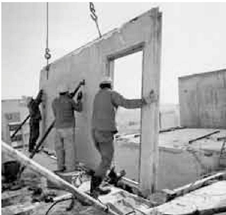
Abb. 10: Auf horizontalen Stahl-tischen wurden Wandelemente in der Fabrik fixfertig vorbereitet. Sie mussten auf der Baustelle nur noch platziert und verankert werden (Firmenarchiv Göhner AG, Aus: Widmer, Ernst Göhner).