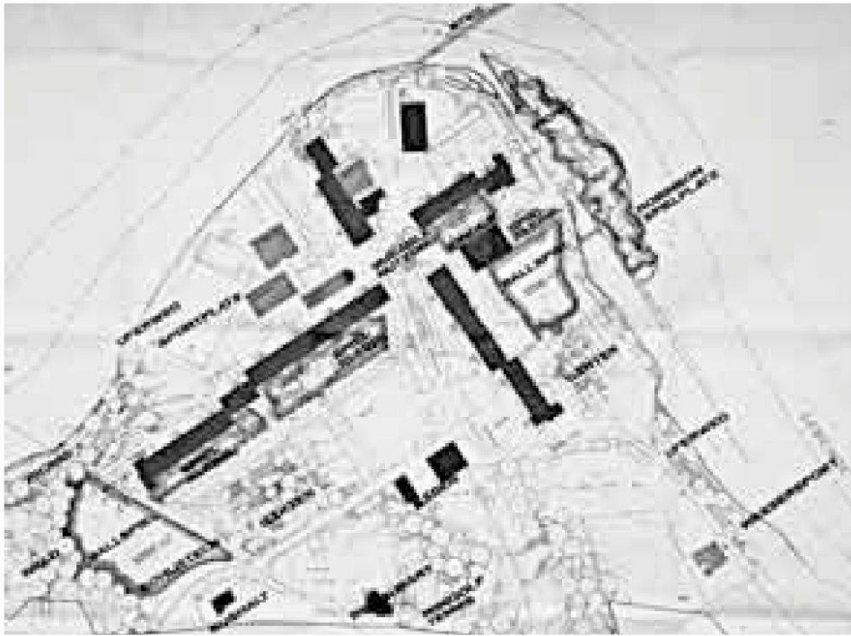
Abb. 2: Ausschnitt aus dem Gestaltungsplan von 1972. Längst nicht alle sozialen Einrichtungen wurden realisiert, aber doch die notwendigen, sodass die Siedlung funktioniert.