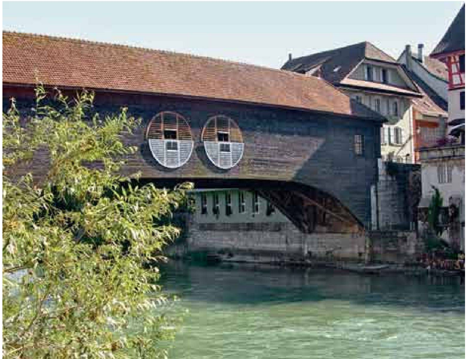
Die Holzbrücke: Wächter des Überganges, Wächter des Flusses.