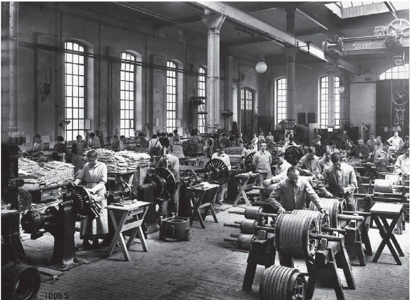
Abb. 3: In einer Werkhalle von BBC werden um 1918 Motoren gewickelt. Wie bei Fritz Frei geschildert, trägt der Werkmeister zwar ein Überkleid, hebt sich aber mit der Krawatte von den Arbeiterinnen und Arbeitern ab.