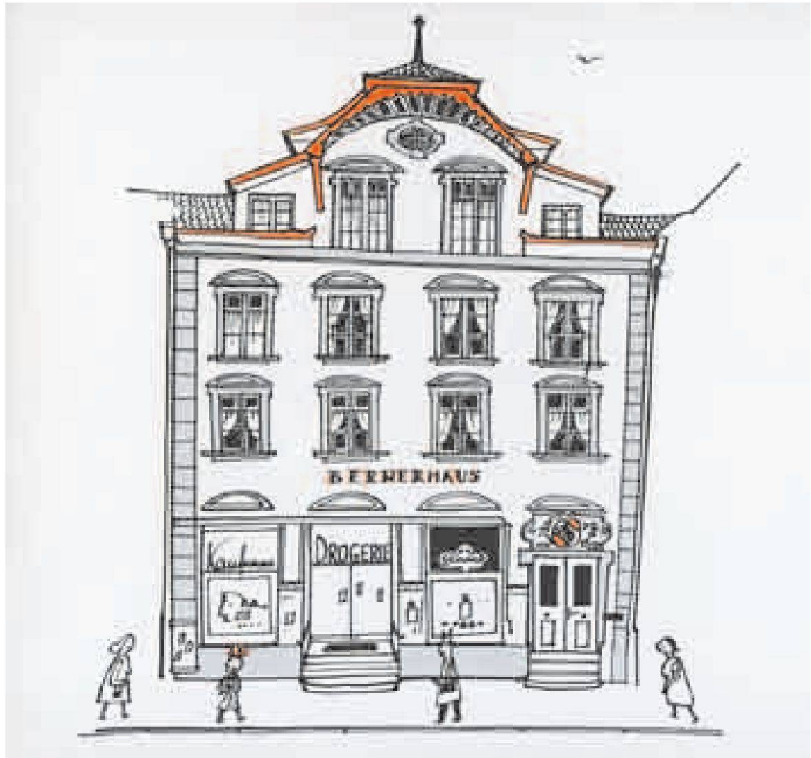
Abb. 1: Das Mädchen vor dem «Bernerhaus».