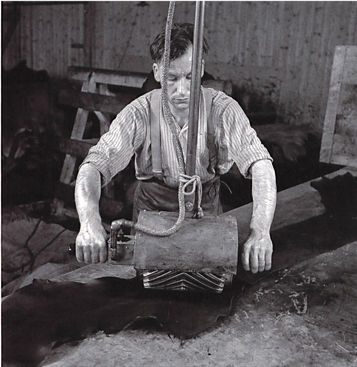
Ausrecken mit Maschine

Ausrecken mit Maschine. Damit die Haut flach und gleichmässig wird, muss sie in feuchtem Zustand – ähnlich einem Teig – gestreckt werden. Bei dicken Häuten ist dazu eine Tischausreckmaschine nötig. Bild: Q.01.2131.