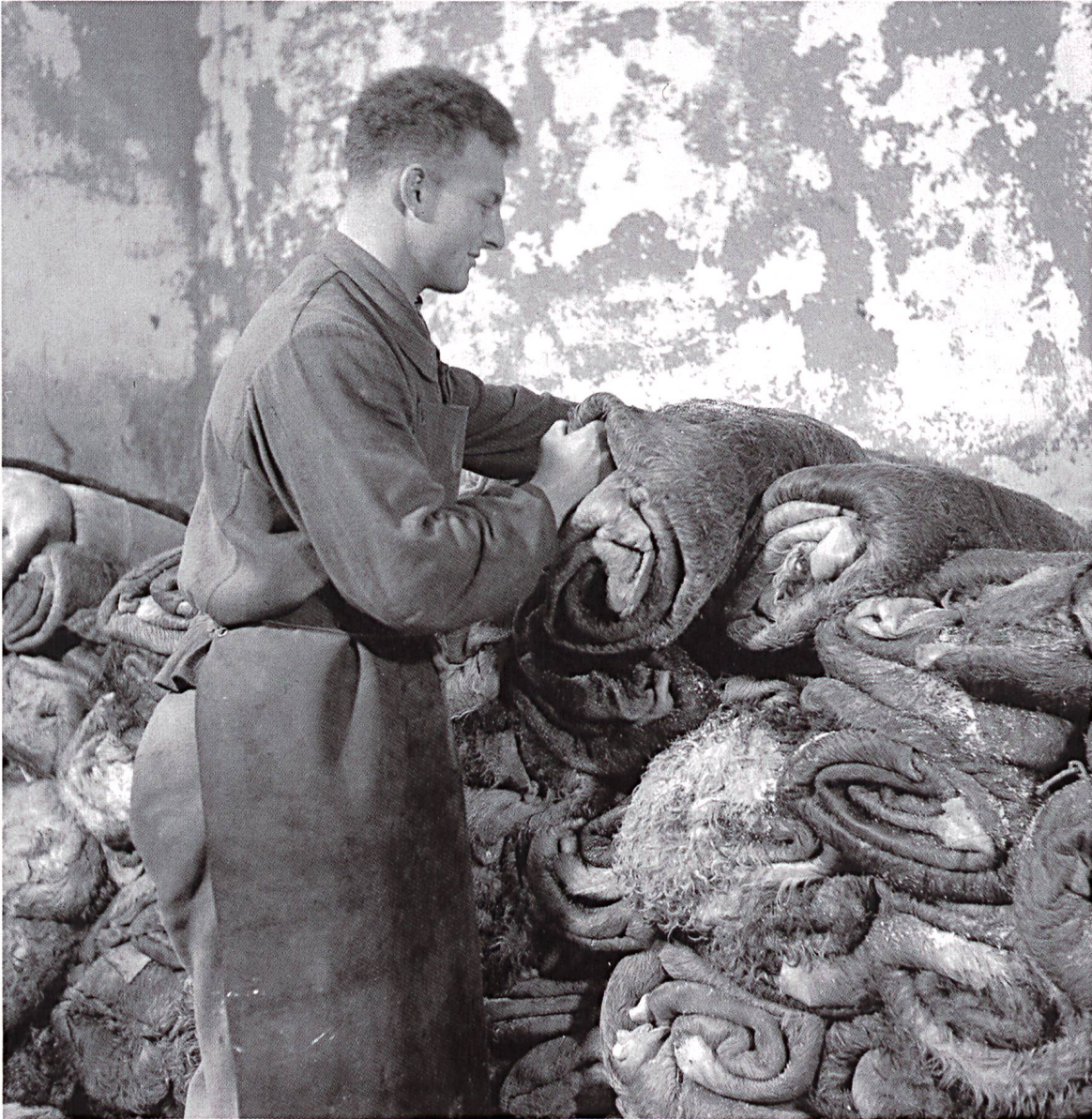
Rohfell- oder Häutemagazin

Rohfell- oder Häutemagazin. Metzgereien und Landwirte liefern ihre rohen Häute an, die dann bis zu ihrer Verarbeitung aufgerollt gelagert werden. Die Rohware wird entweder durch Trocknen oder Salzen konserviert. Beim Salzen wird der Haut Feuchtigkeit entzogen und so der Fäulnisprozess verlangsamt. Bild: Q.01.2100.