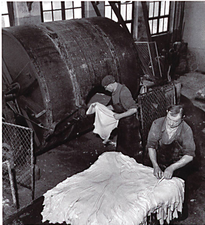
Pickeln und Gerben