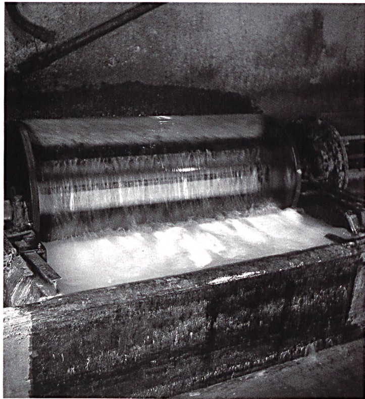
Haspel für die Weiche