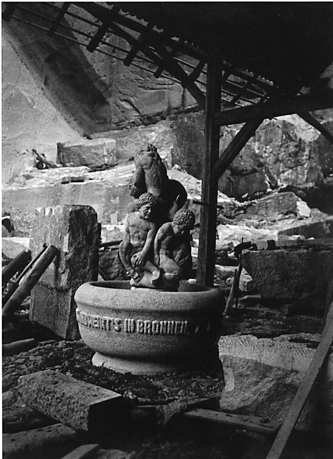
Hans Trudel schuf den Tränenbrunnen im Steinbruch Würenlos, wie eine Fotografie von 1918 zeigt.