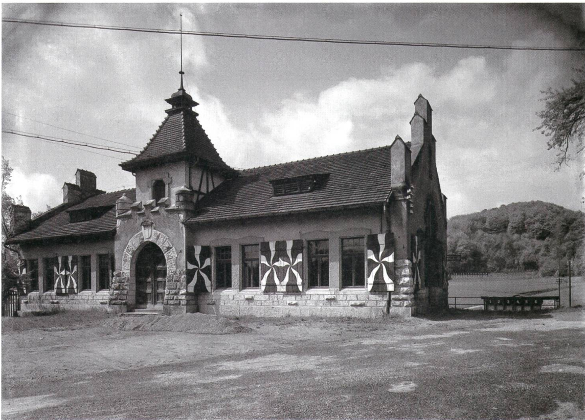
Das Schützenhaus auf der Allmend im Jahr 1933.