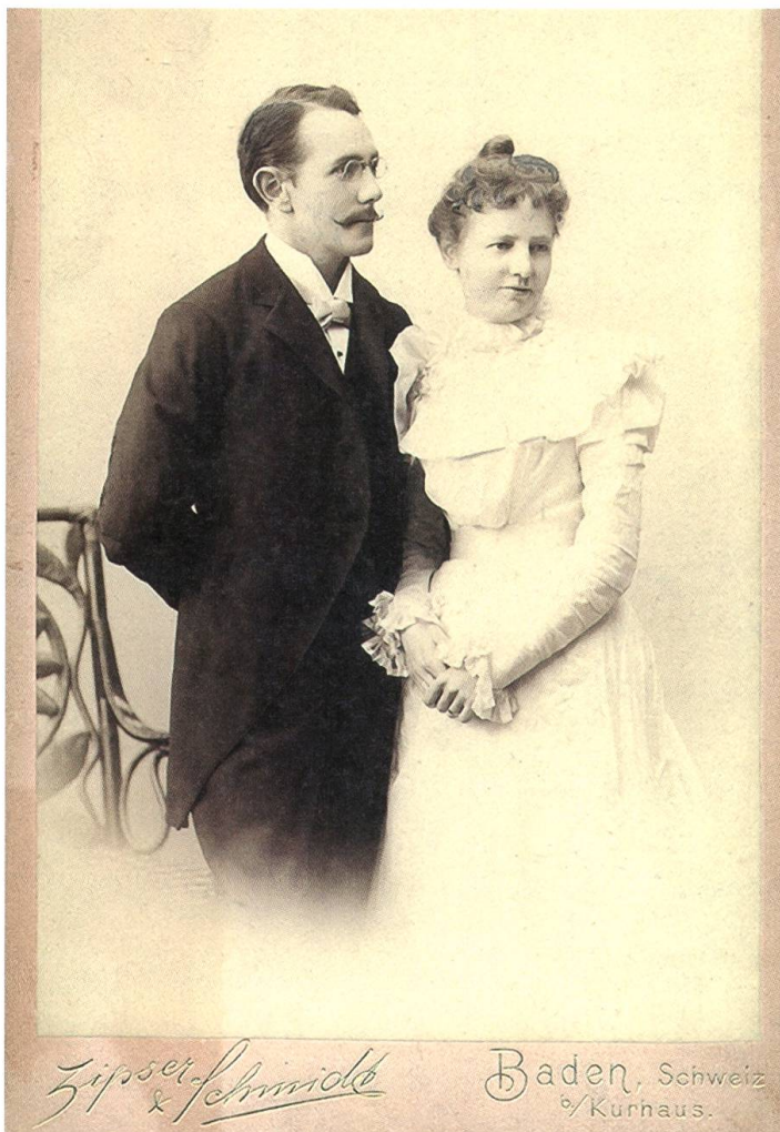
Die Heiratsanzeige in der deutschen Version für Verwandte und Bekannte in der Schweiz.