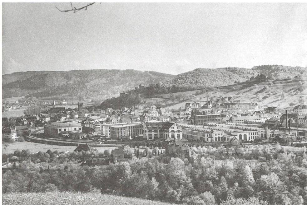
Baden (BBC und Haselquartier) ab Goldwand, um 1925.