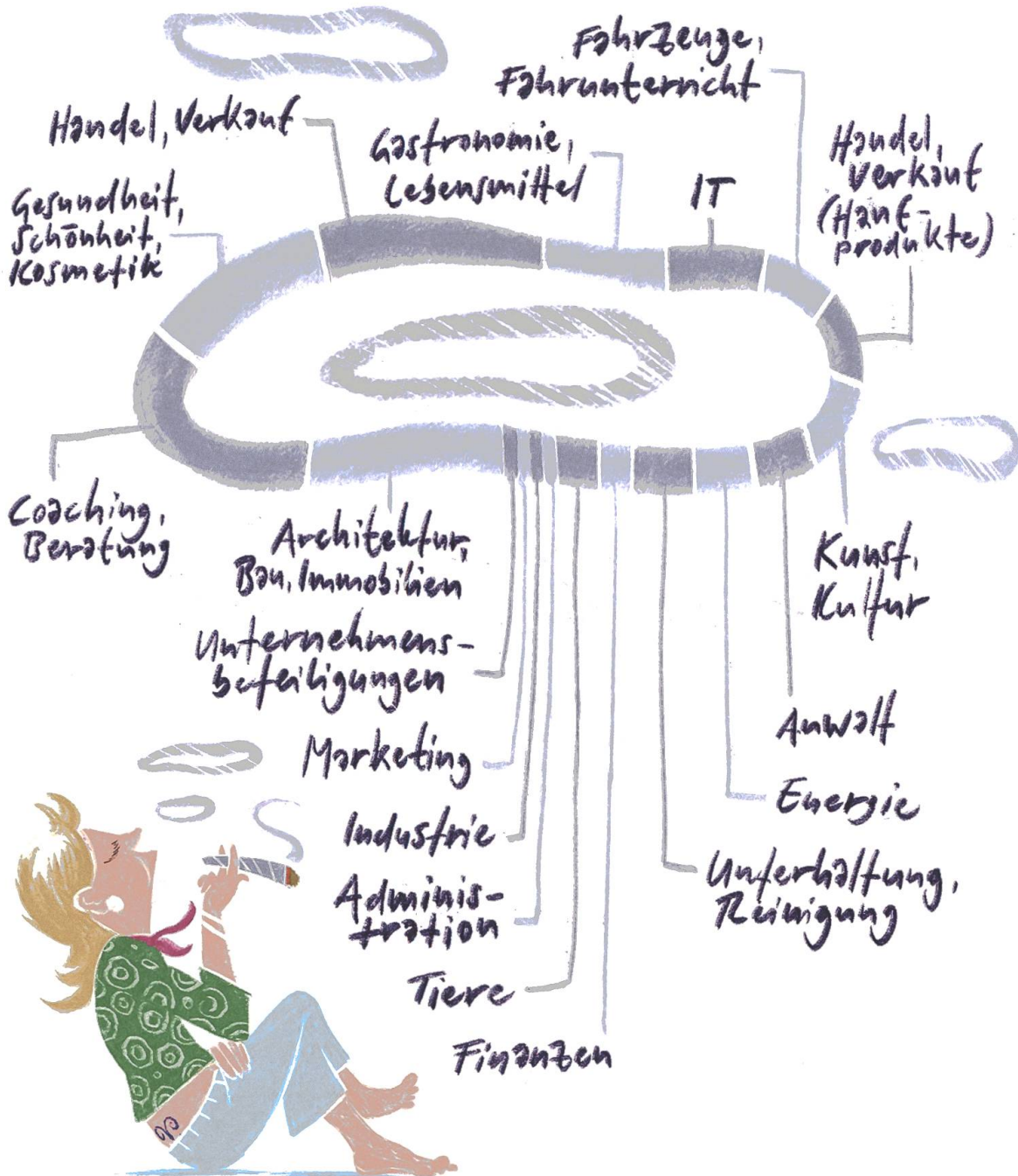
Grafik 3: Neugründungen in Baden. 9, 10, 11