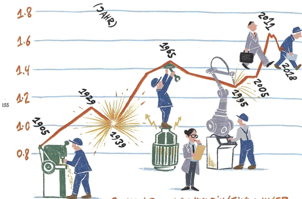
Grafik 1: Beschäftigte pro Kopf. 5, 6, 7

STELLEN PRO EINWOHNERIN/EINWOHNER IM 2. UND 3. SEKTOR, STADT BADEN