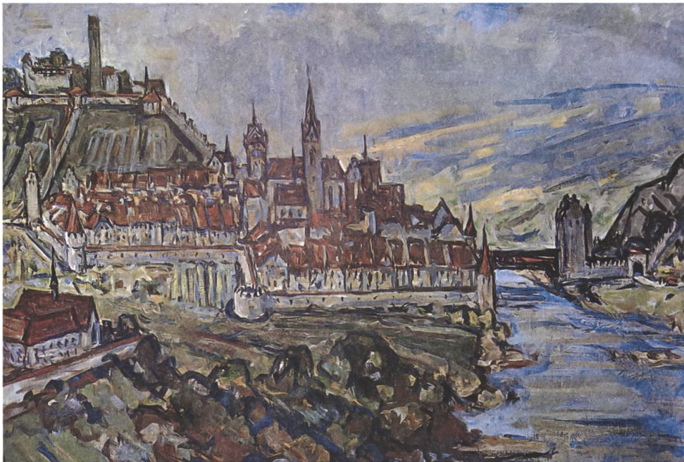
Mittelalterliche Talsperre, Heinrich Waser, 1967.