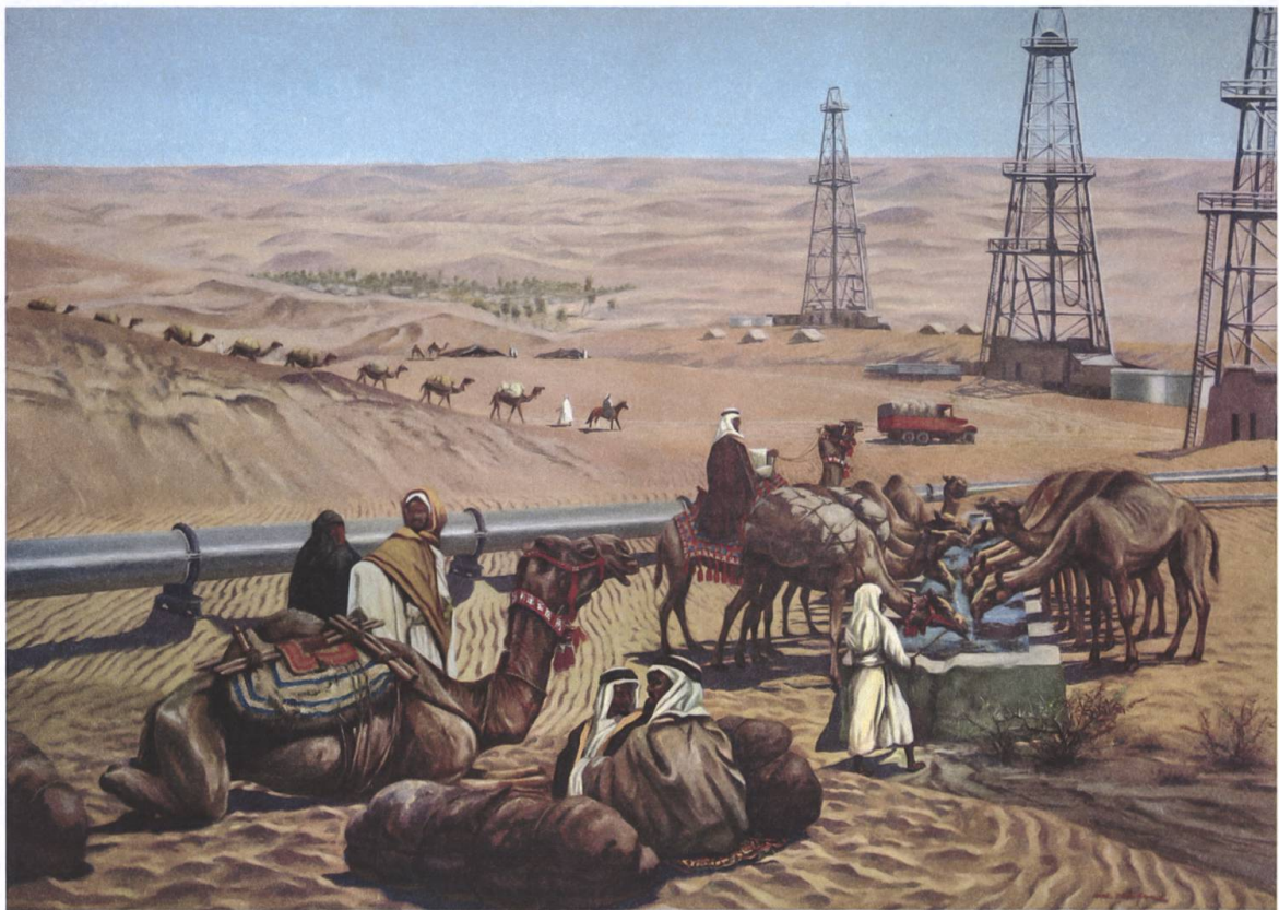
Beduinen rasten an einer Ölförderstation, undatiert.