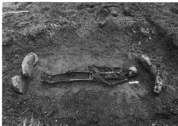
Tomba maschile periodo Punuk ( la gabbia toracica era trafitta da 13 punte di freccia )

Per questa ragione si è costituito un Comitato internazionale di Archeologi-Eschimesi che mira, attraverso scavi sistematici, a salvare ciò che è ancora salvabile. Coordinatore di questo gruppo è l'etnoarcheologo neocastellano Yvon Csonka, che è sposato con una Cukci e quindi ha in loco degli ottimi contatti. Da poco l'INTAS (International Association for the promotion of cooperation with scientists from the independent states of the former Soviet Union) ha accordato un credito a questo scopo, che rappresenta almeno un buon aiuto iniziale. A questo progetto di ricerca per la protezione di reperti tombali (e in futuro forse anche di reperti insediativi) partecipa anche la "Fondazione Svizzera-Liechtenstein per le ricerche archeologiche all'estero"; essa spera soprattutto attraverso l'impegno di Yvon Csonka di contribuire alla salvaguardia dell'eredità nazionale della popolazione primitiva sulla penisola dei Cukci.