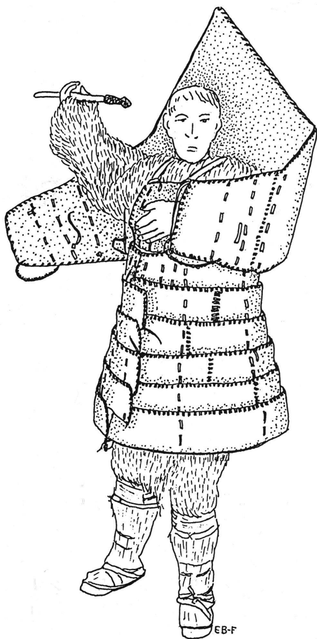
La corazza "Punuk" che proteggeva tutto il corpo

colonizzazione russa e americana i rapporti fra gli Yupik siberiani sull'Isola S. Lorenzo e sulla costa della penisola dei Cukci da una parte e Cukci, che parlavano un'altra lingua, dall'altra, erano tesi e forse anche decisamente ostili.