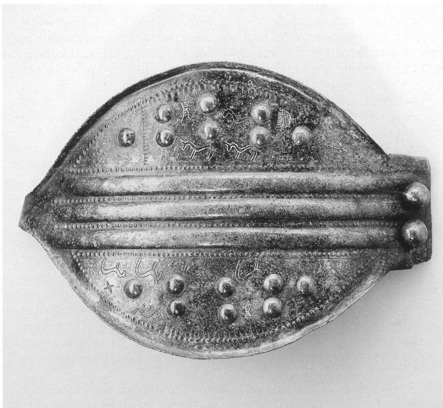
Fig. 1. Gancio da cintura femminile in bronzo da Arbedo-Cerinasca; V secolo a. C..

I Leponti furono anche dei guerrieri, come testimoniano le numerose armi rinvenute per la maggior parte nella necropoli di Giubiasco, vicino a Bellinzona: spade e foderi, elmi, punte di lancia e asce da combattimento, ispirate all'equipaggiamento di altre popolazioni, in parte utilizzando elementi importati, in parte producendone imita-