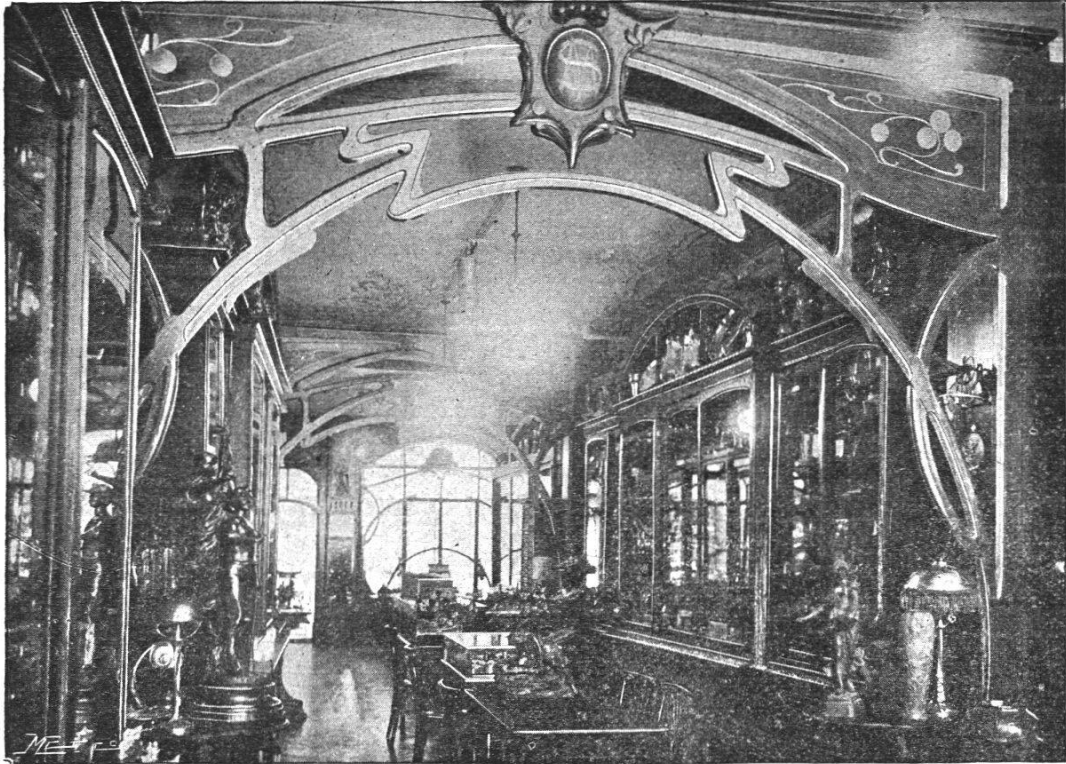
Ansicht des Magazins