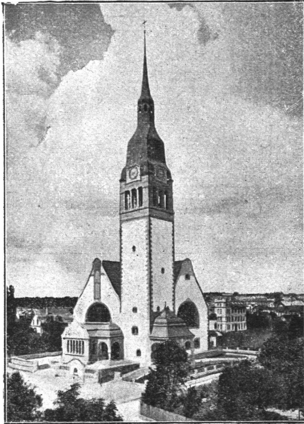
Pauluskirche in Bern.