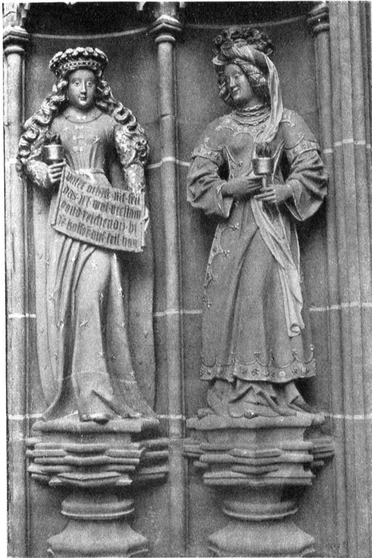
Zwei kluge Jungfrauen