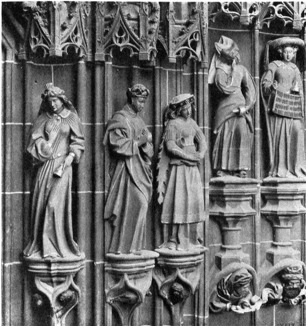
Die fünf t6rchten Jungfrauen