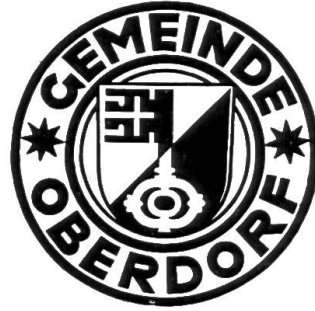
Bild 4. Gemeindestempel von Oberdorf,

Wappen: Niederdorf: Weiss und rot schräggeteilt mit aufrecht stehendem gotischem Schlüssel, mit dem Buchstaben N im Schlüsselgriff, in gewechselten Tinkturen.