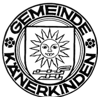
Bild 1. Gemeindestempel von Känerkinden