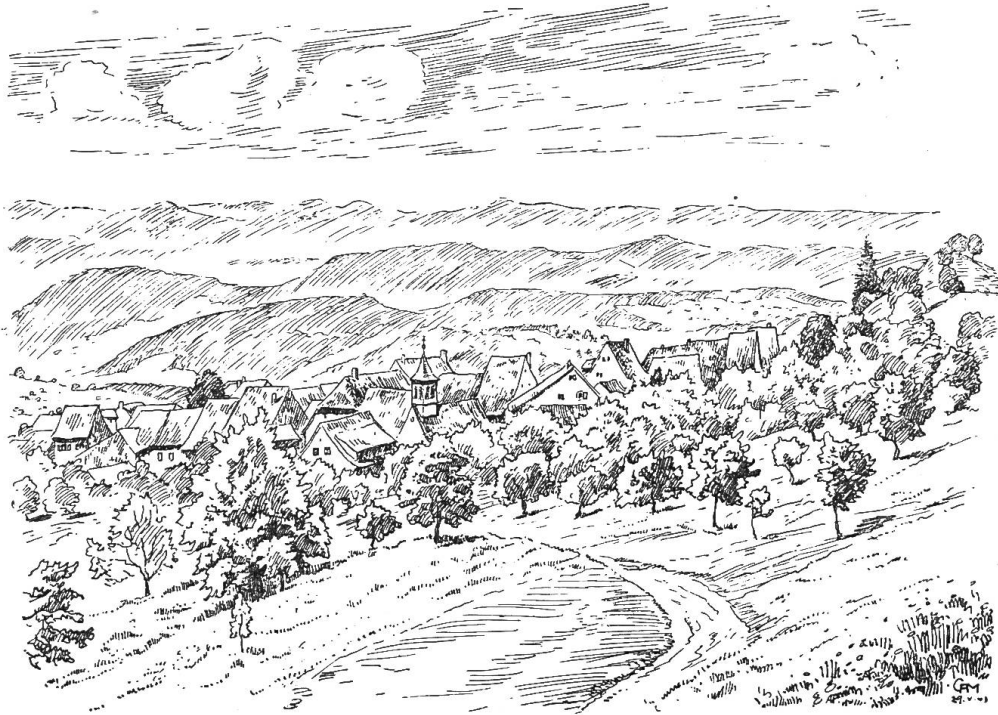
Titterten gegen Norden.

man, sog. Nebenschulen einzurichten. Die Stadt Basel und die Hauptschulen sahen diese Entwicklung nicht gern und suchten sie zu hemmen. So musste jedes Kind einer Nebenschule an den Lehrer der Hauptschule Schullohn bezahlen. In Basel sagte man auch, die Jugend sei früher bei weitem Schulweg robust gewesen, jetzt aber werde sie verzärtelt. Die ökonomische Lage der Lehrer an Nebenschulen war noch schlimmer als die der andern. «Der Schulmeister von Hemmiken, obwohl ein feiner und geschickter Bauern-Schulmeister, ist von einem ordinari Gassen-Bettler nicht wohl zu unterscheiden», schreibt