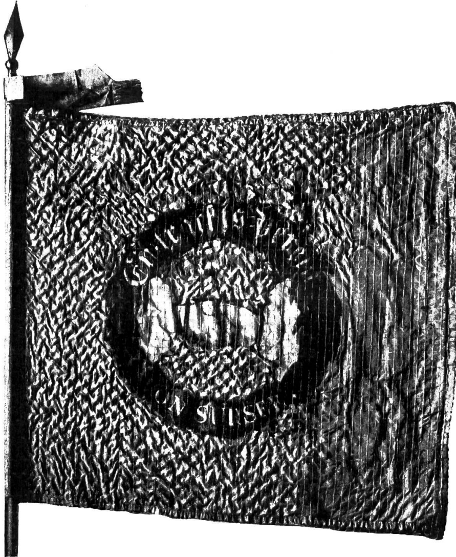
Fahne aus grüner Seide, bemalt, verschlungene Hände. Aufschrift «Eintrachts-Verein von Sursee». Kantonsmuseum Liestal. Geschenk des genannten Vereines an die Truppe anlässlich der Rückkehr in die Heimat.

henden Hauptquartier und dem unserigen inzwischen ein lebhafter Depeschenwechsel stattgefunden, in welchem gegenseitig zur Uebergabe ermahnt und aufgefordert wurde, riss schliesslich unserm Oberkommando die schon allzulange Geduld, und es wurde dem Feinde eine