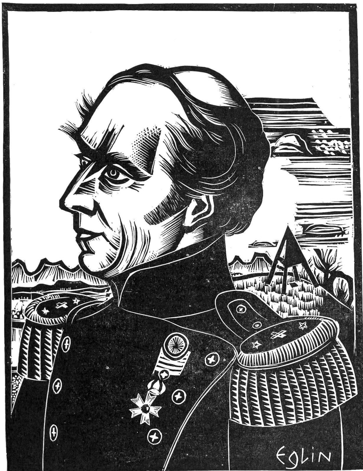
General W. H. Dufour.