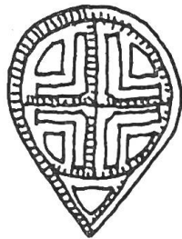
Bild 1. Kreuzförmiges Bronze-Amulett aus dem Pfahlbau Mörigen.

Selbstverständlich waren für die Wahl des Siedlungsortes gute Lebensbedingungen die primäre Voraussetzung: Trinkwasser, Jagdgründe, Weiden, Aecker, Verteidigungsmöglichkeiten, günstige Lage an Verkehrswegen. Unter allen in diesem Sinne vorteilhaften, d. h. prinzipiell möglichen Siedlungsorten wurden aber vielfach diejenigen Stellen gewählt, die gegenseitig in Nordsüd- oder Ostwest-Beziehung standen. Mit anderen Worten: Nicht nur rein militärische Ueberlegungen, die wir heute etwas zu überschätzen pflegen, waren in früheren Zeiten bei der Wahl des Siedlungsortes massgebend,